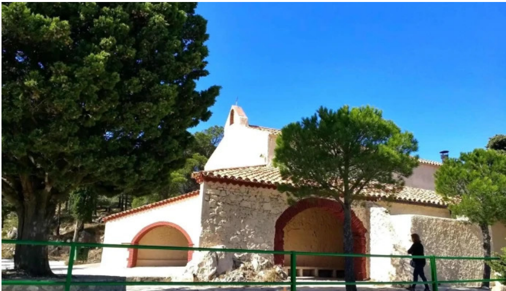
Ermita del pinell de brai iglesia