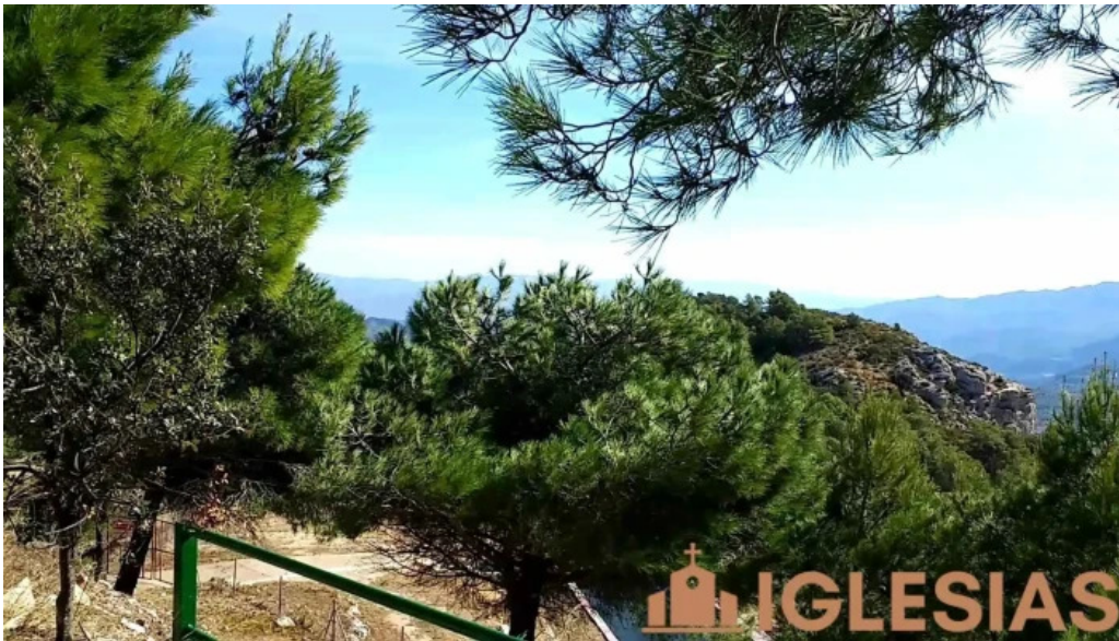
Ermita del pinell de brai videos