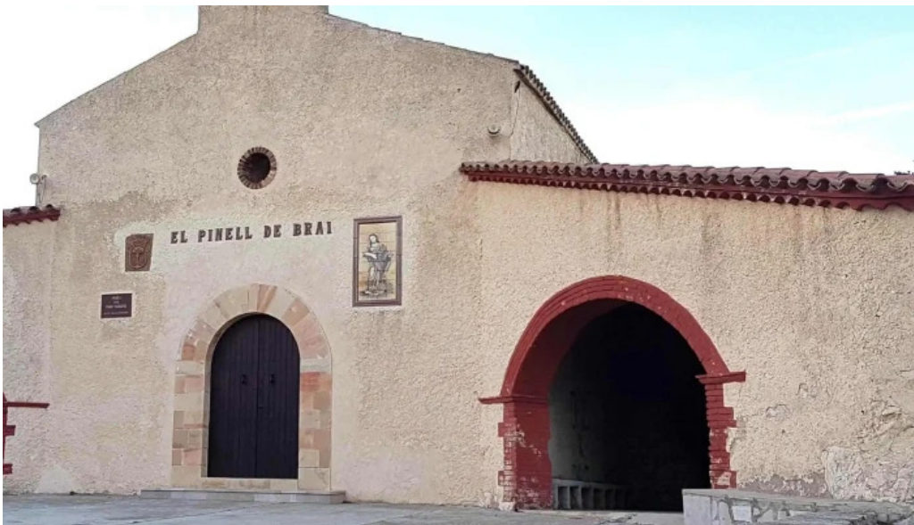
Ermita del pinell de brai tarragona