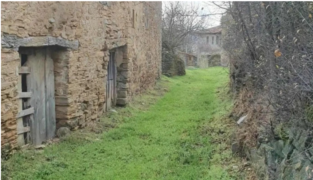
Iglesia de santiago apostol iglesia