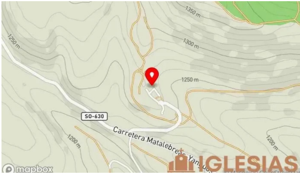
Iglesia de santiago apostol mapa