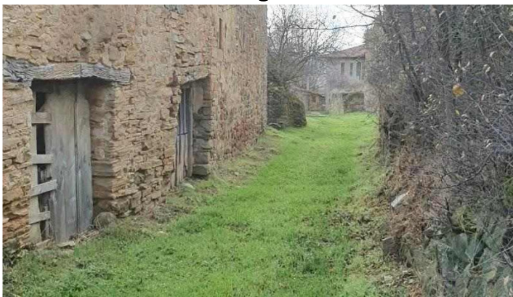
Iglesia de santiago apostol tanine