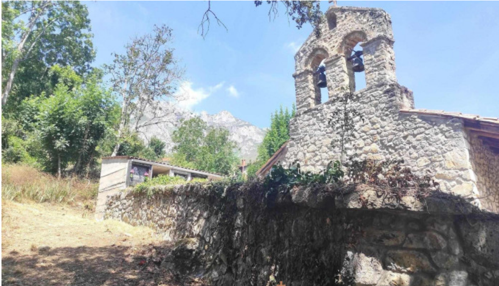
Iglesia de santa maria de los morales iglesia