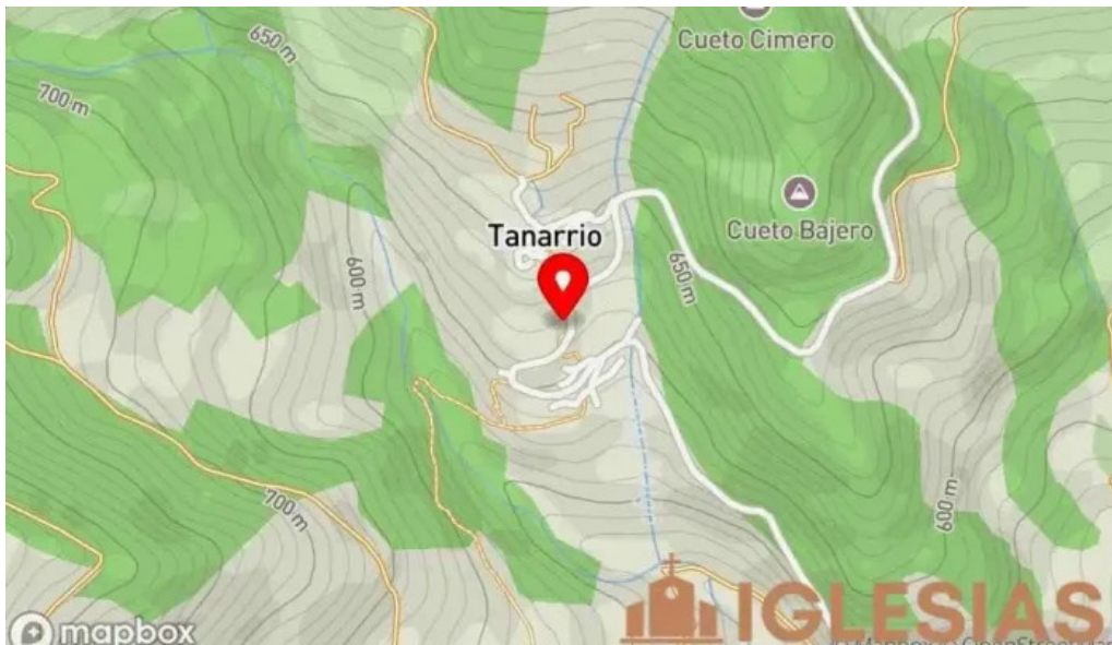
Iglesia de santa maria de los morales mapa