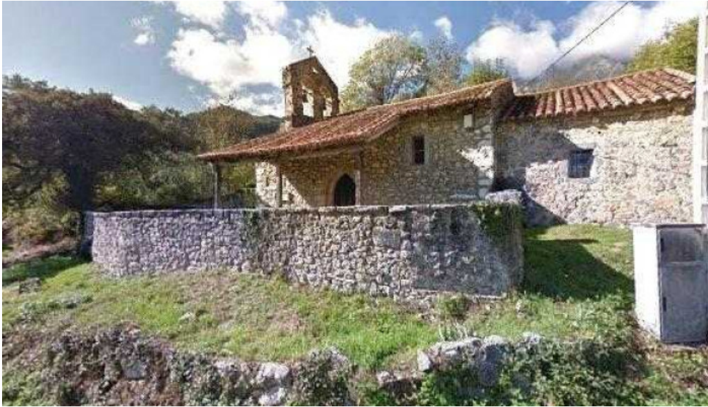
Iglesia de santa maria de los morales numero