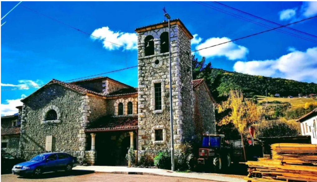
Iglesia de nuestra senora de los angeles iglesia