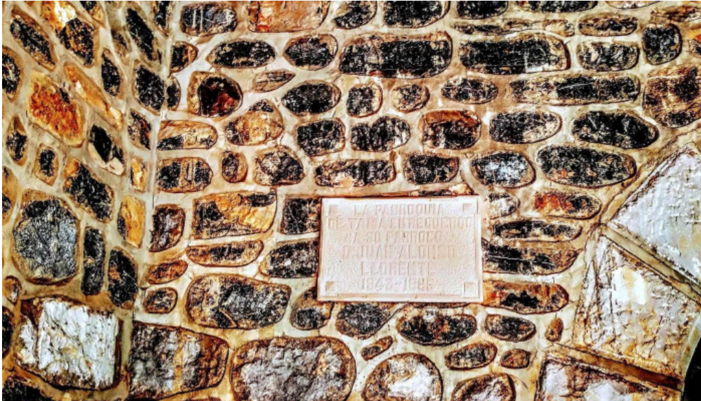
Iglesia de nuestra senora de los angeles comentarios