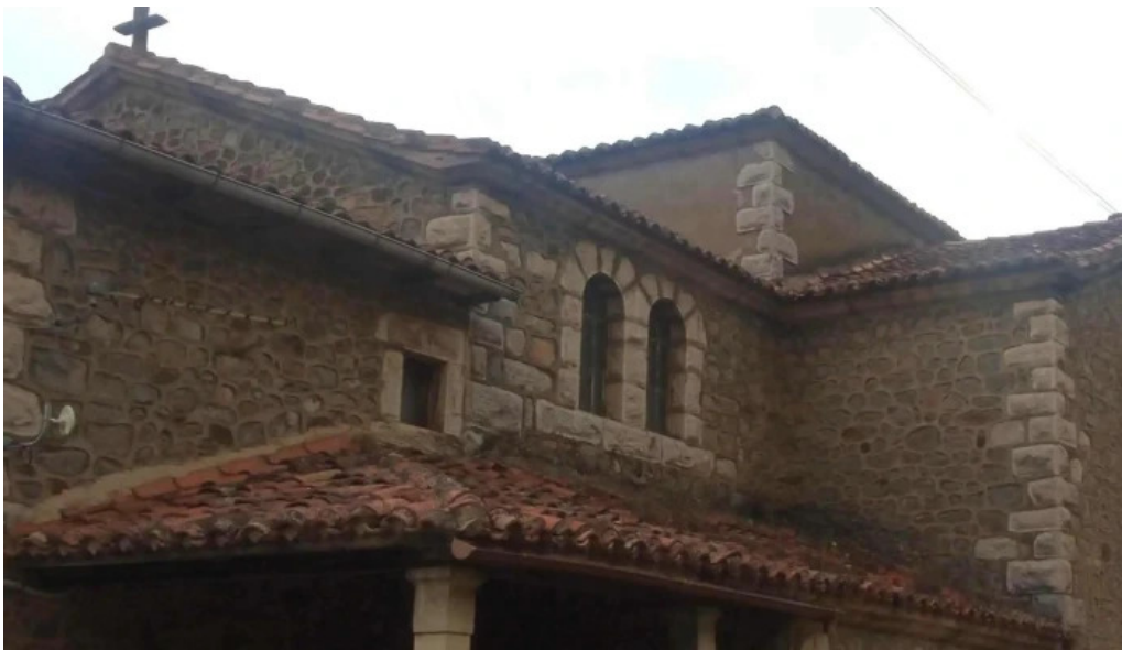
Iglesia de nuestra senora de los angeles tama