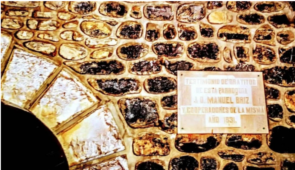
Iglesia de nuestra senora de los angeles instagram