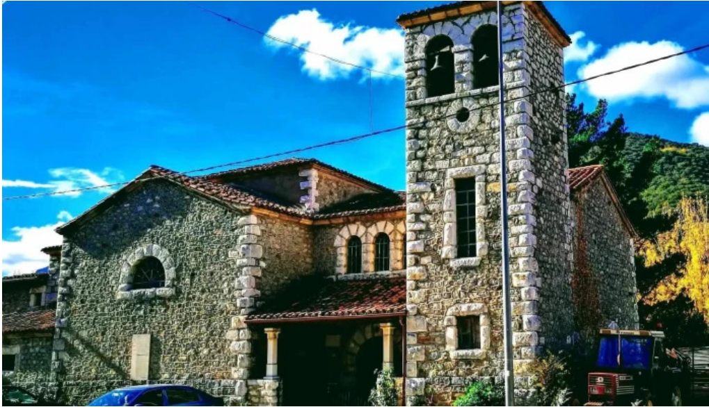
Iglesia de nuestra senora de los angeles direccion