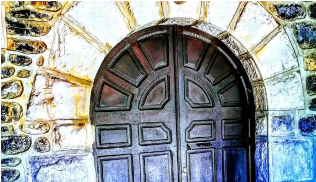
Iglesia de nuestra senora de los angeles descuentos