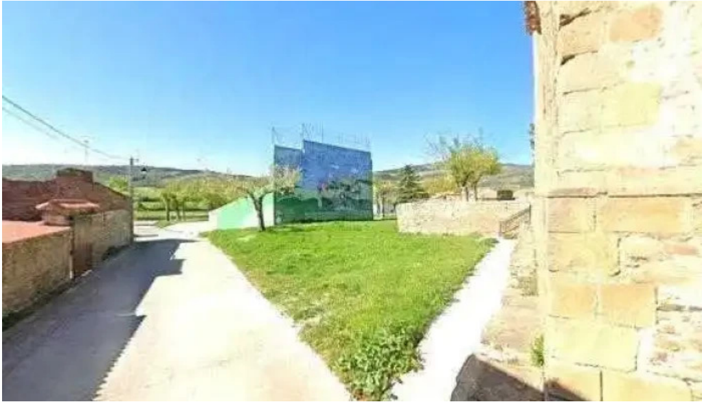
Iglesia parroquial de el salvador salvador