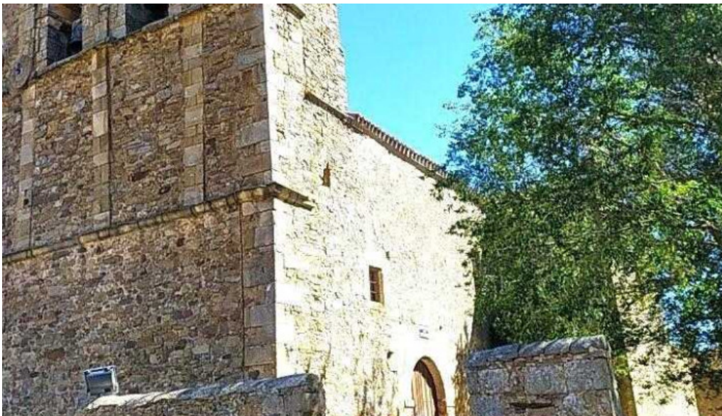
Iglesia parroquial de el salvador suellacabras