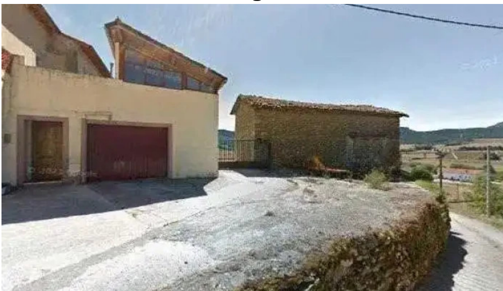
Iglesia de nuestra senora de la asuncion videos