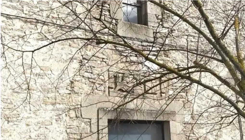
Iglesia de nuestra senora de la asuncion iglesia