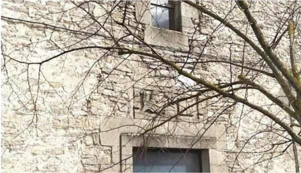
Iglesia de nuestra señora de la asuncion subijana morillas