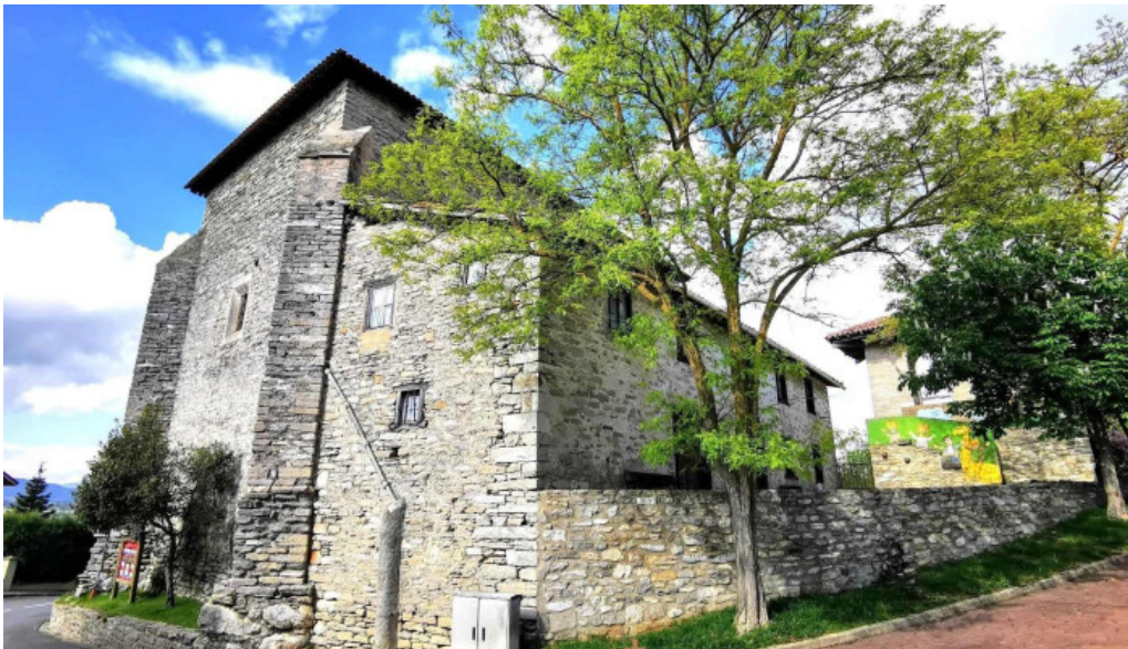
Iglesia de san esteban iglesia