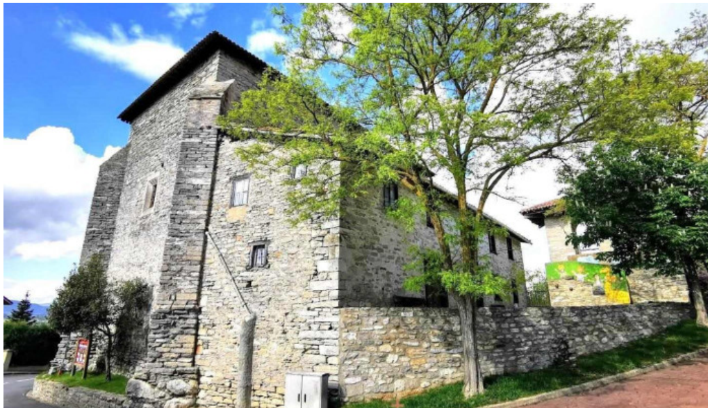
Iglesia de san esteban subijana de alava