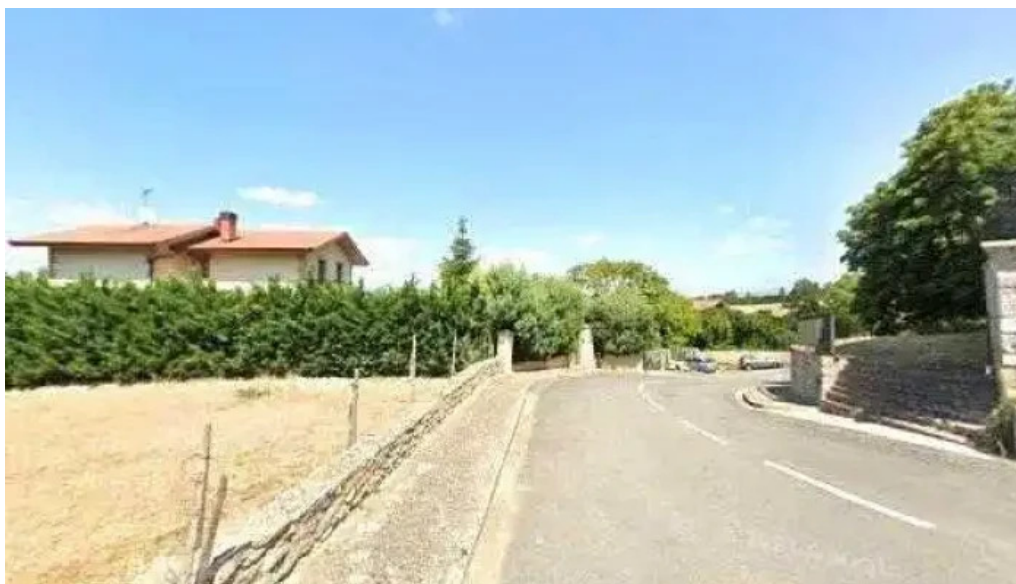
Iglesia de san esteban direccion