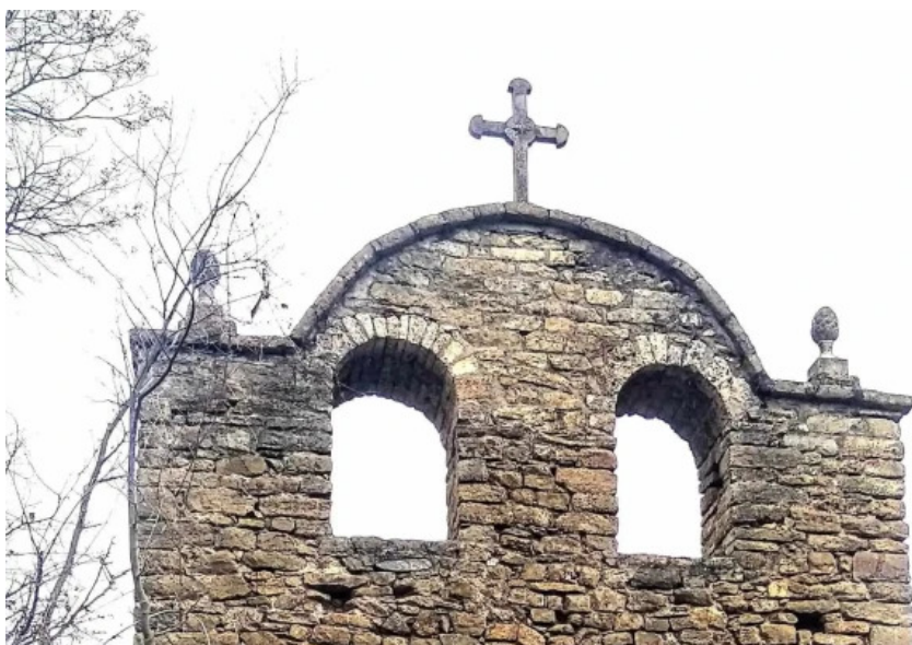
Santuario de la mare de deu del soler sort