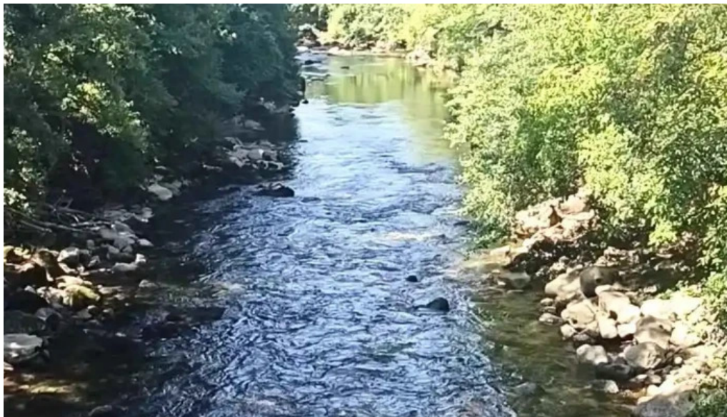
Santuario de la mare de deu del soler videos