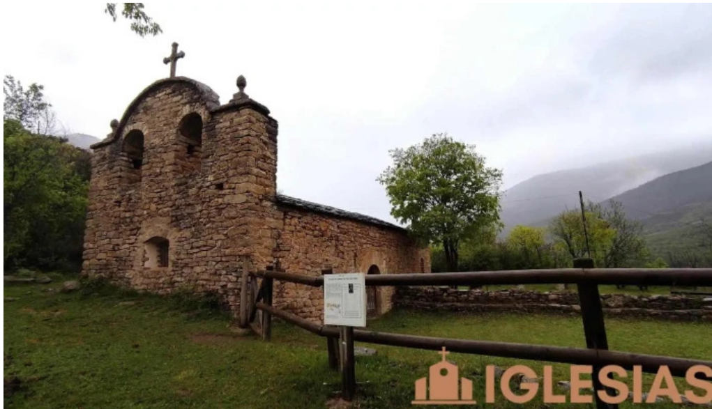
Santuario de la mare de deu del soler iglesia