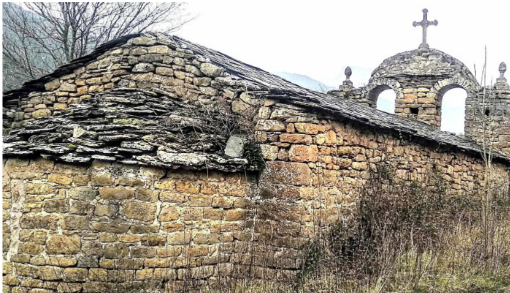
Santuario de la mare de deu del soler descuentos