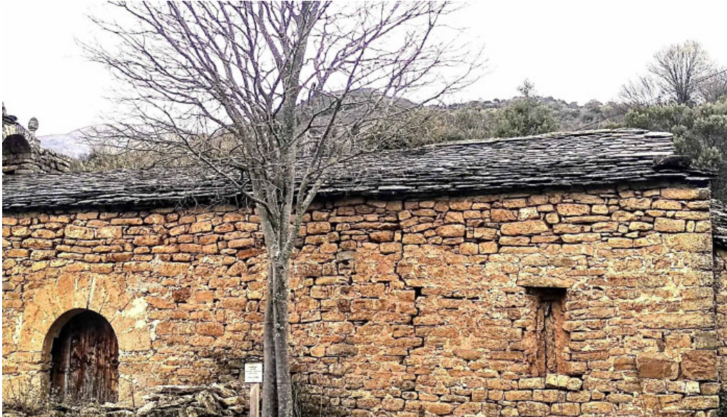
Santuario de la mare de deu del soler cerca de mi