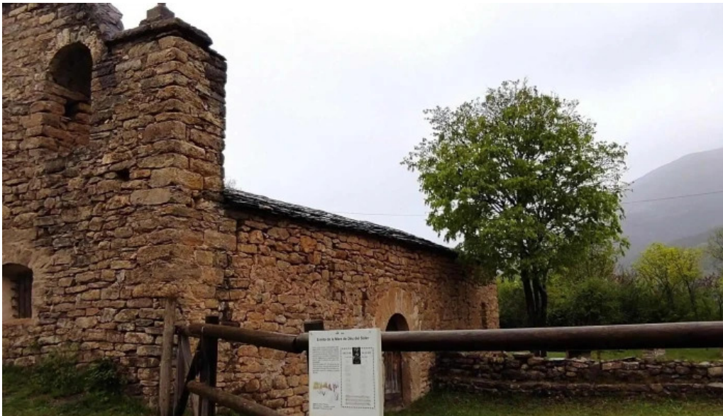
Santuario de la mare de deu del soler opinions