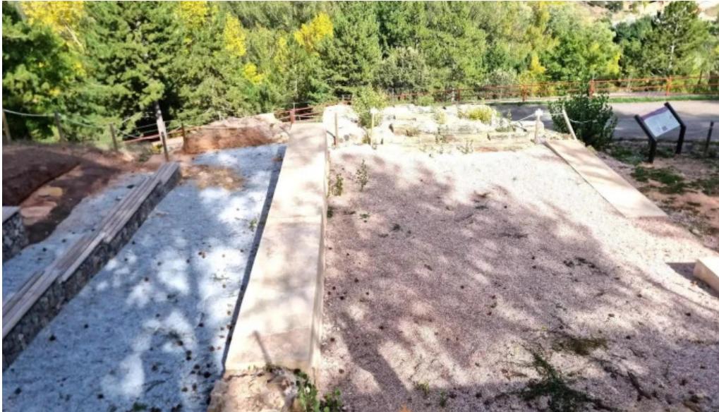
Ruinas de la iglesia de san martin de la cuesta iglesia