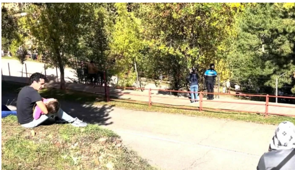
Ruinas de la iglesia de san martin de la cuesta precios