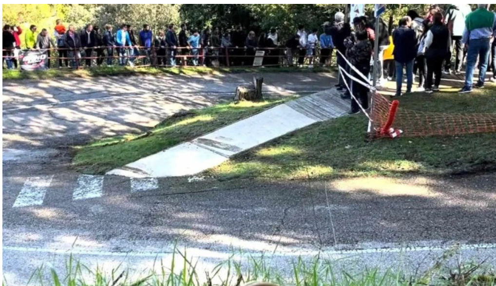
Ruinas de la iglesia de san martin de la cuesta soria