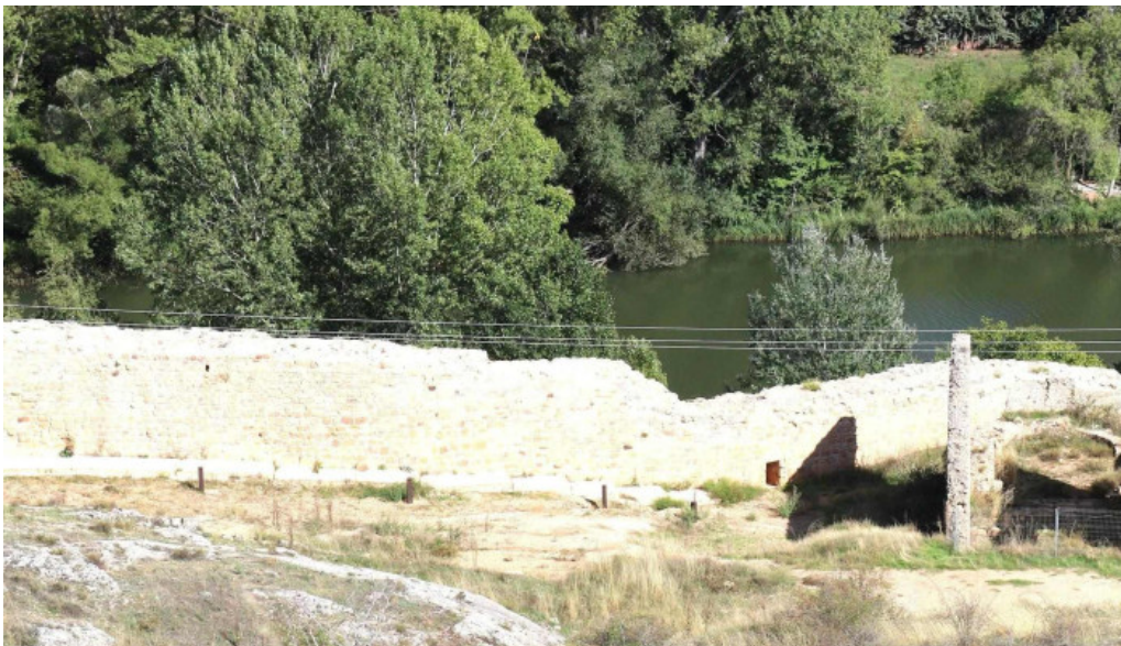
Restos de la iglesia de san gines soria