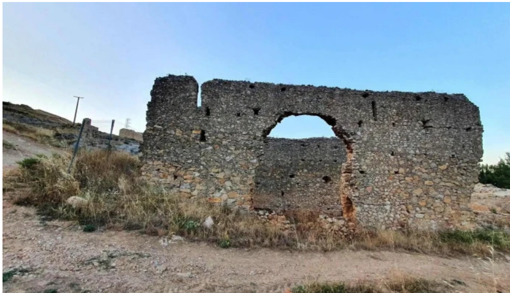
Restos de la iglesia de san gines iglesia