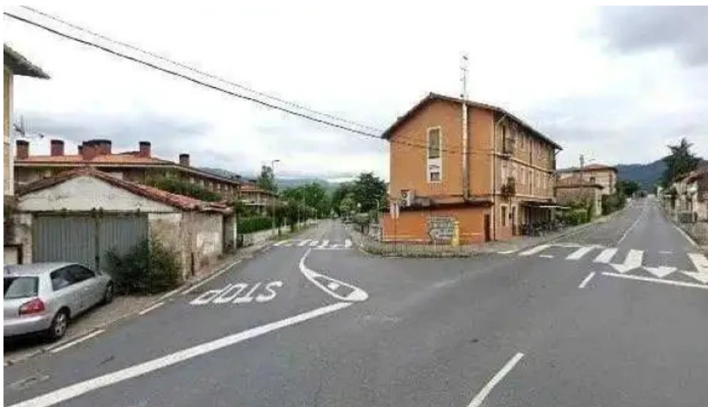
Seminario san viator iglesia