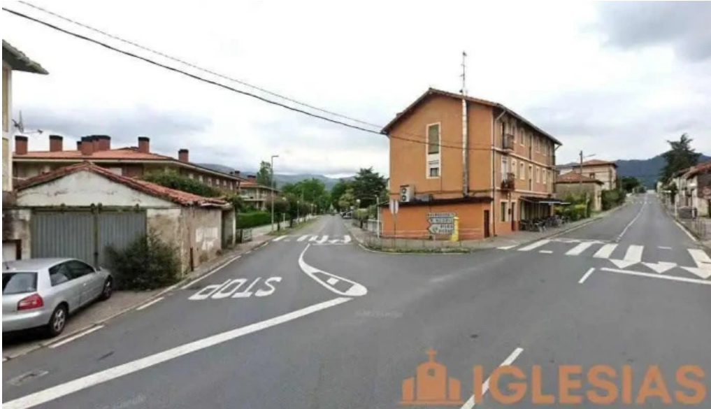
Seminario san viator sopuerta