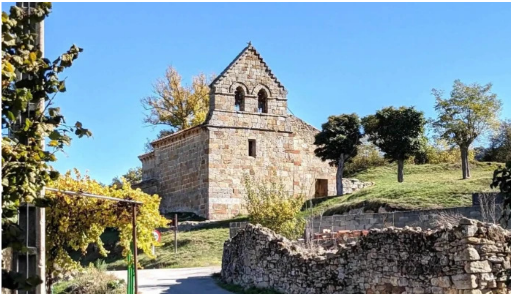
Iglesia de la purisima o de san martin donde