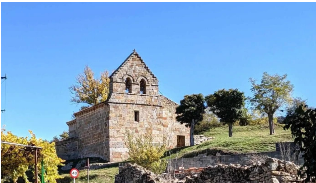
Iglesia de la purísima o de san martin sobrepenilla