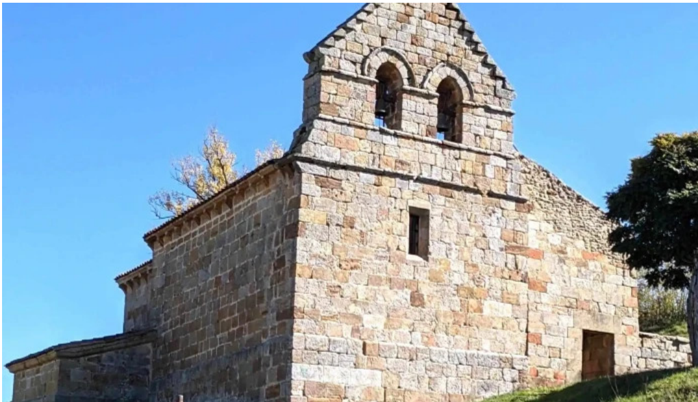
Iglesia de la purisima o de san martin opiniones