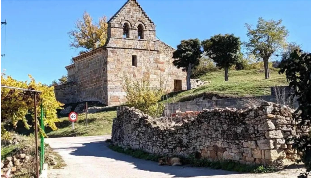
Iglesia de la purisima o de san martin iglesia