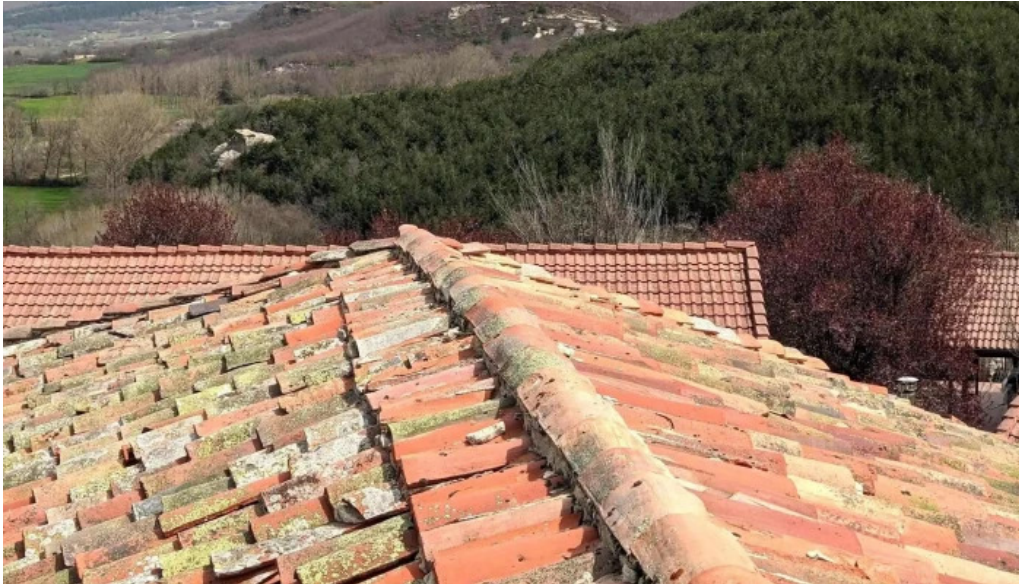
Iglesia de santa juliana sobrepena