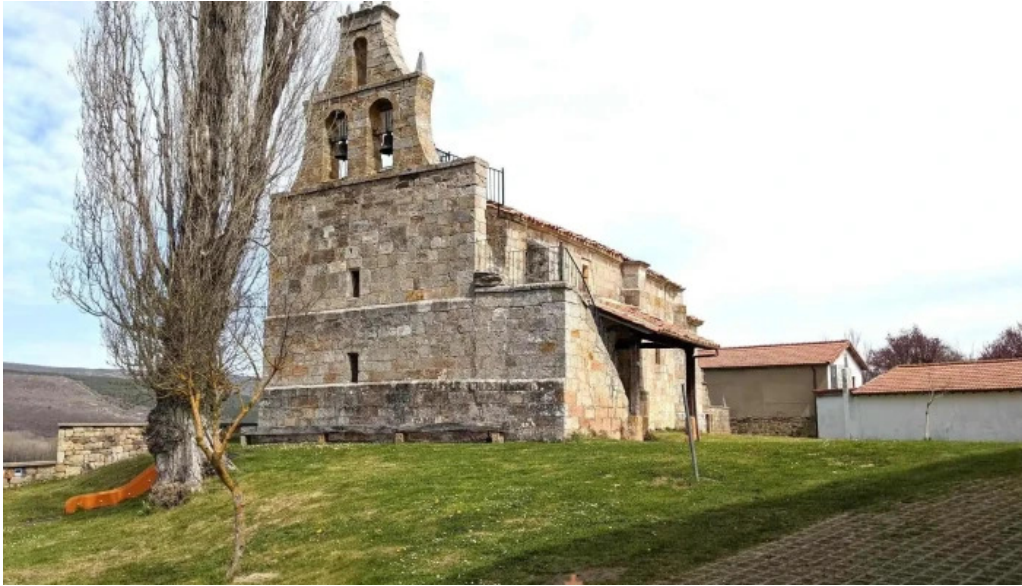
Iglesia de santa juliana iglesia