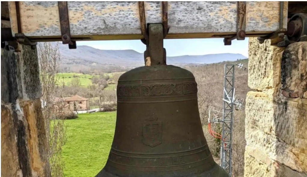
Iglesia de santa juliana descuentos