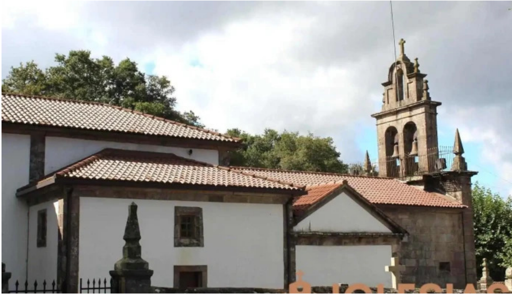
Iglesia de san miguel de siador silleda