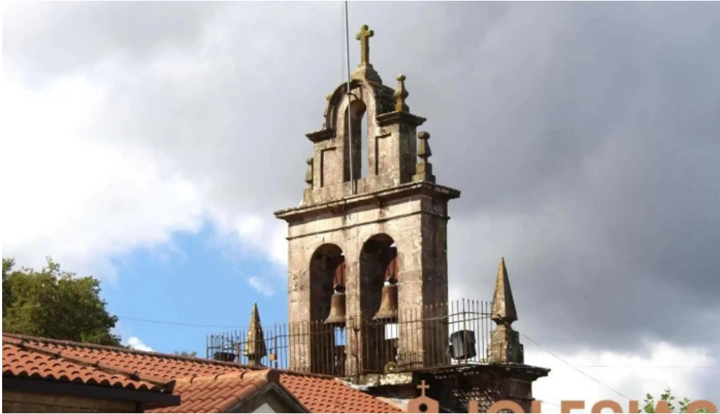
Iglesia de san miguel de siador iglesia