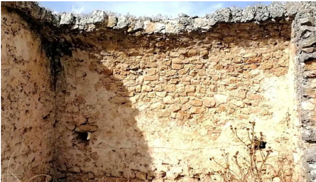
Ermita de balsamos puntaje