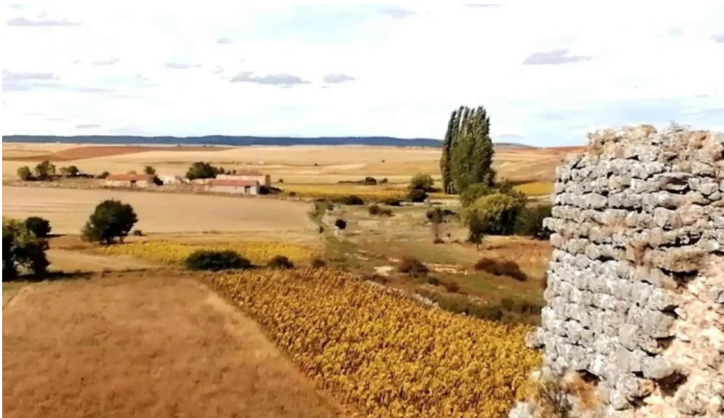
Ermita de balsamos zona