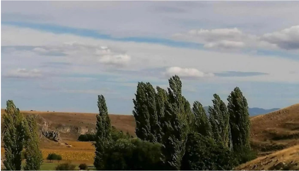
Ermita de balsamos segovia