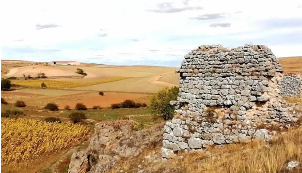
Ermita de balsamos numero