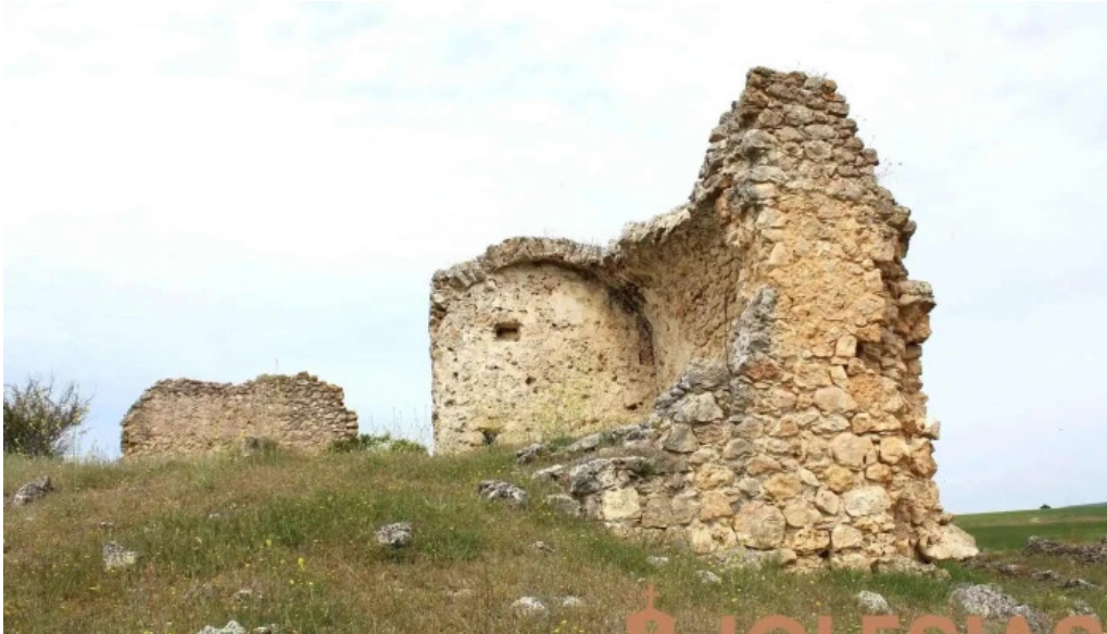
Ermita de balsamos iglesia