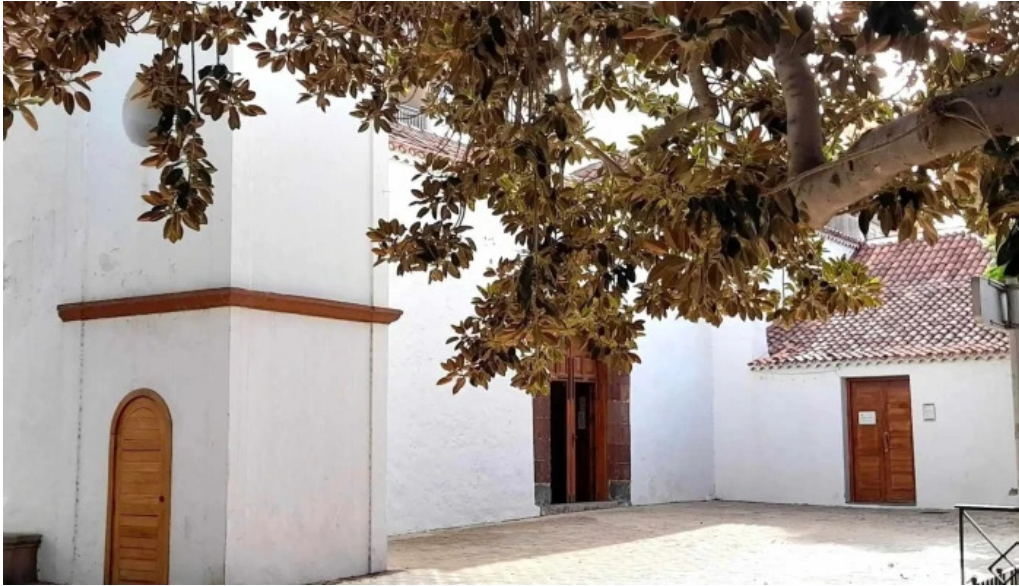
Ermita de san sebastian santa cruz de tenerife