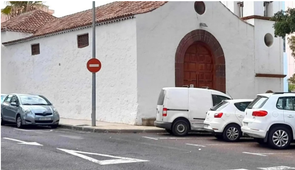
Ermita de san sebastian como llegar