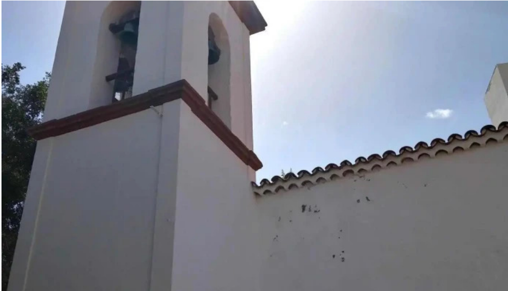
Ermita de san sebastian iglesia