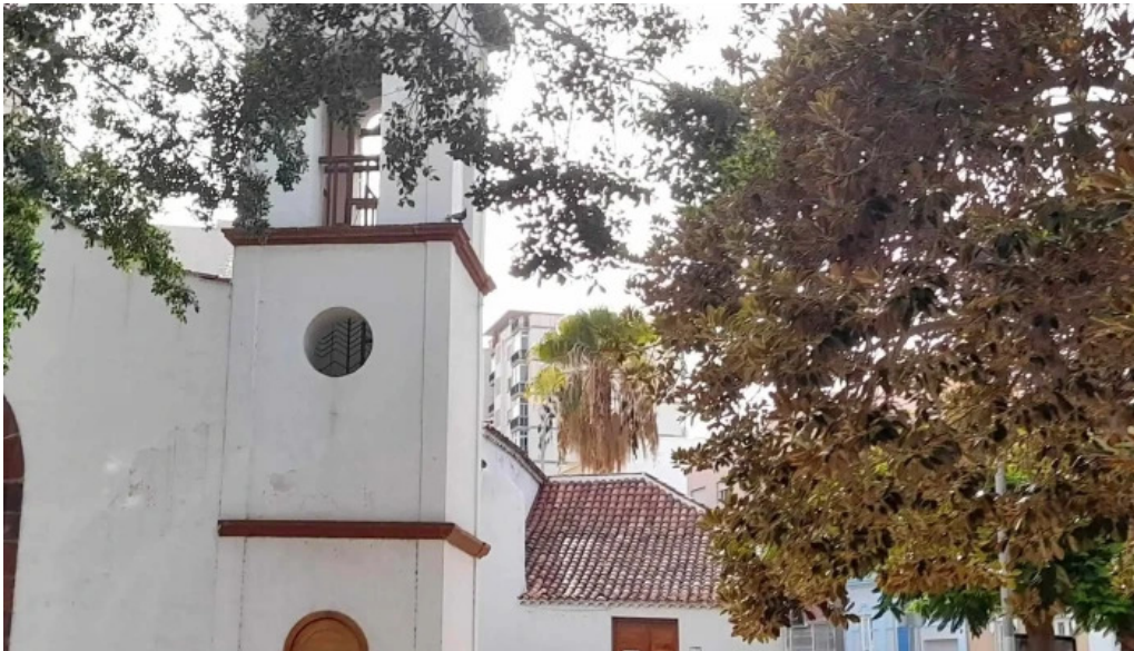
Ermita de san sebastian telefono