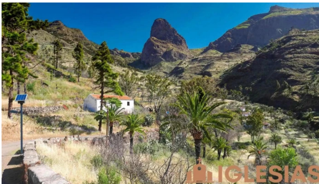
Ermita de san juan iglesia