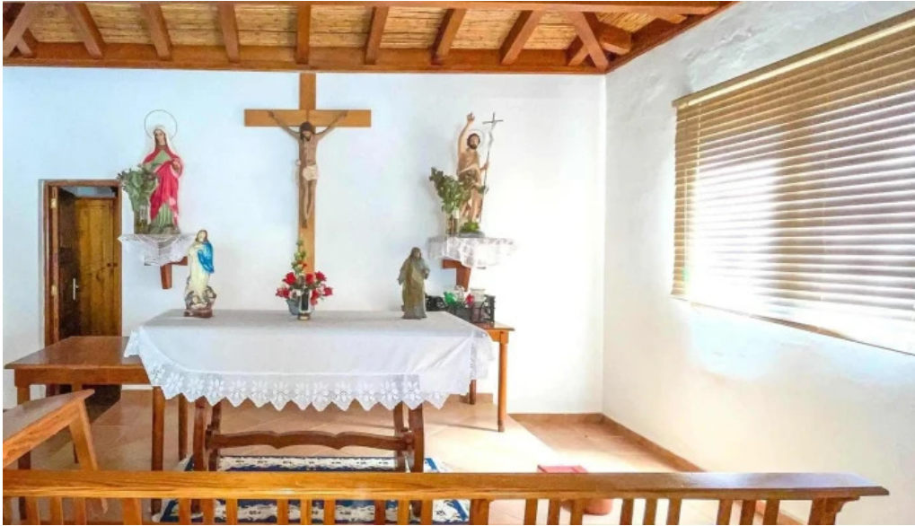
Ermita de san juan san sebastian de la gomera