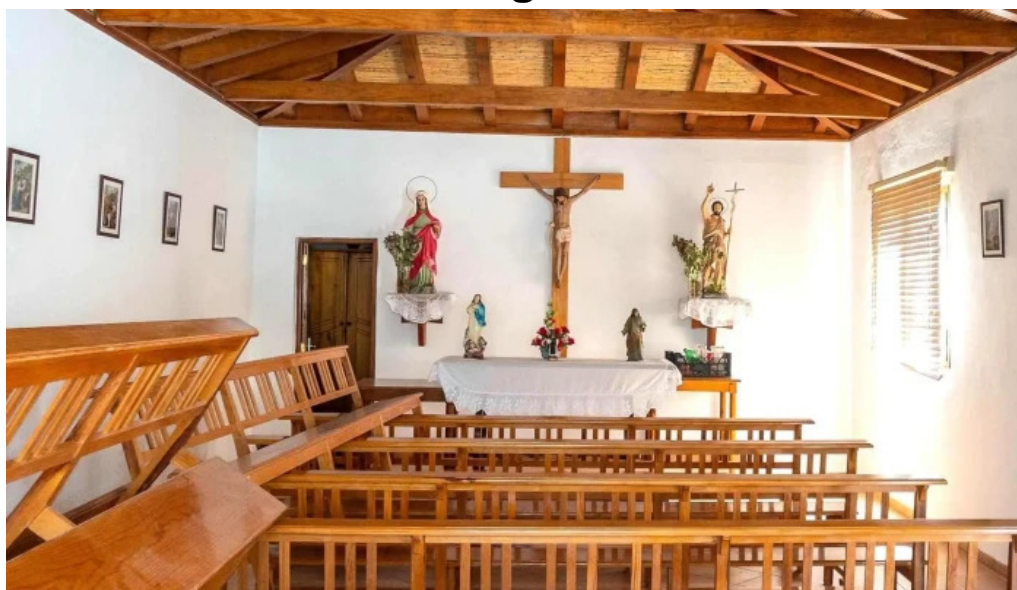
Ermita de san juan videos