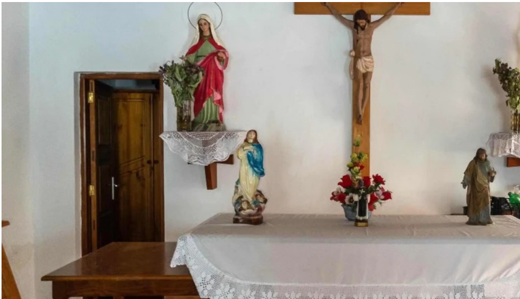
Ermita de san juan sitio web