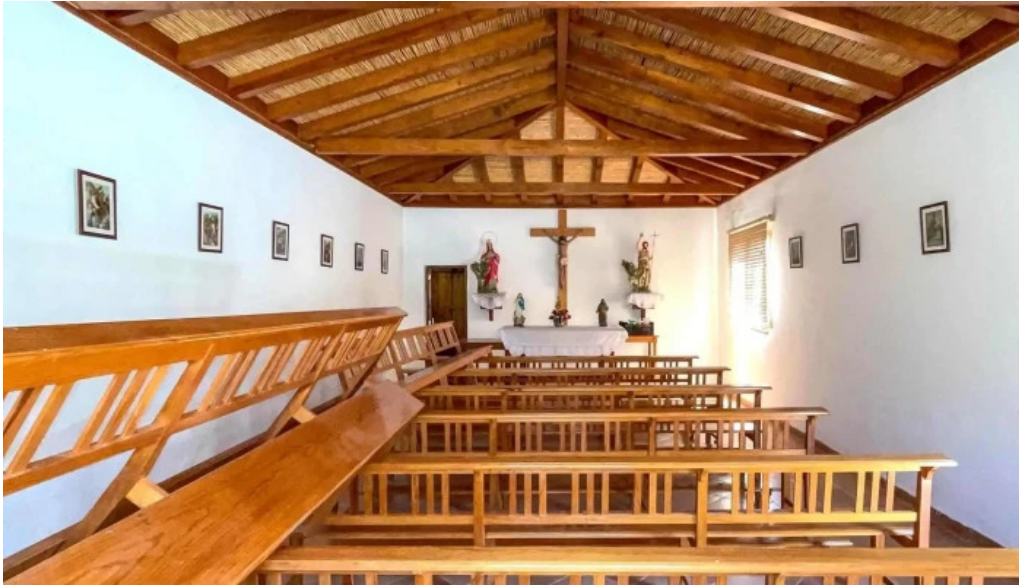
Ermita de san juan ubicacion