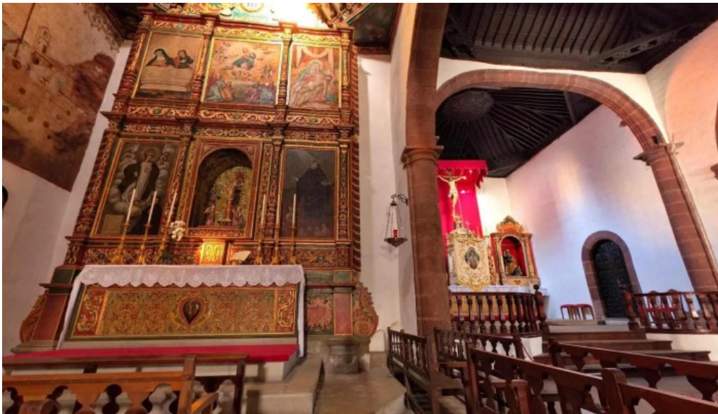
Eglise de la asuncion iglesia