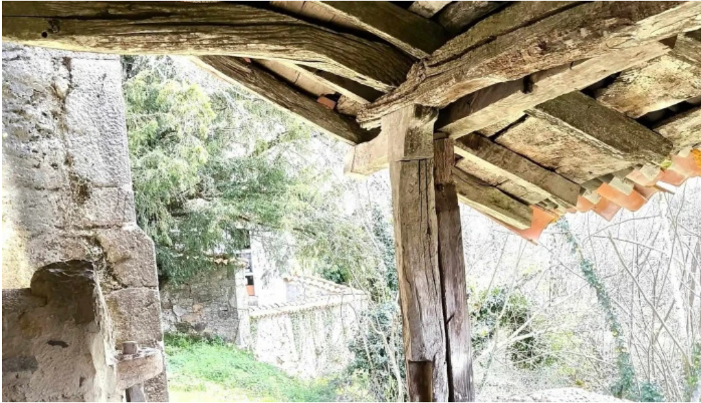
Iglesia de san roman puntaje