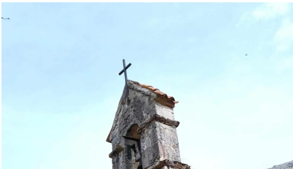
Iglesia de san roman horario