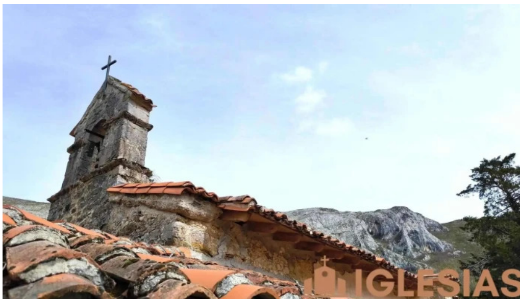
Iglesia de san roman iglesia