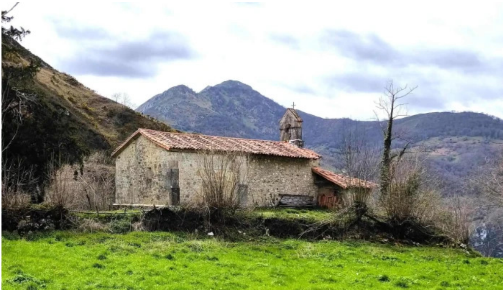
Iglesia de san roman san roman