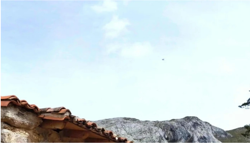
Iglesia de san roman ubicacion