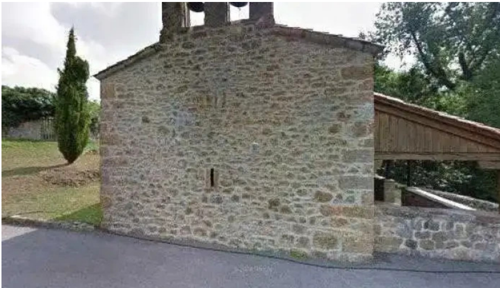
Iglesia de san pedro apostol abierto ahora