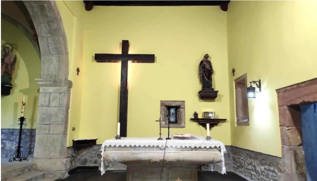
Iglesia de san pedro apostol iglesia