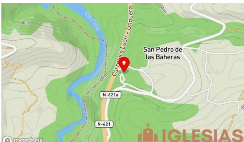
Iglesia de san pedro apostol mapa