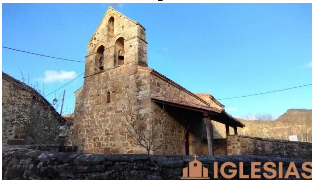
Iglesia de san martin de perapetu san martin de perapertu