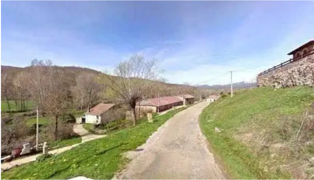
Iglesia de san pedro ad vinculam ubicacion