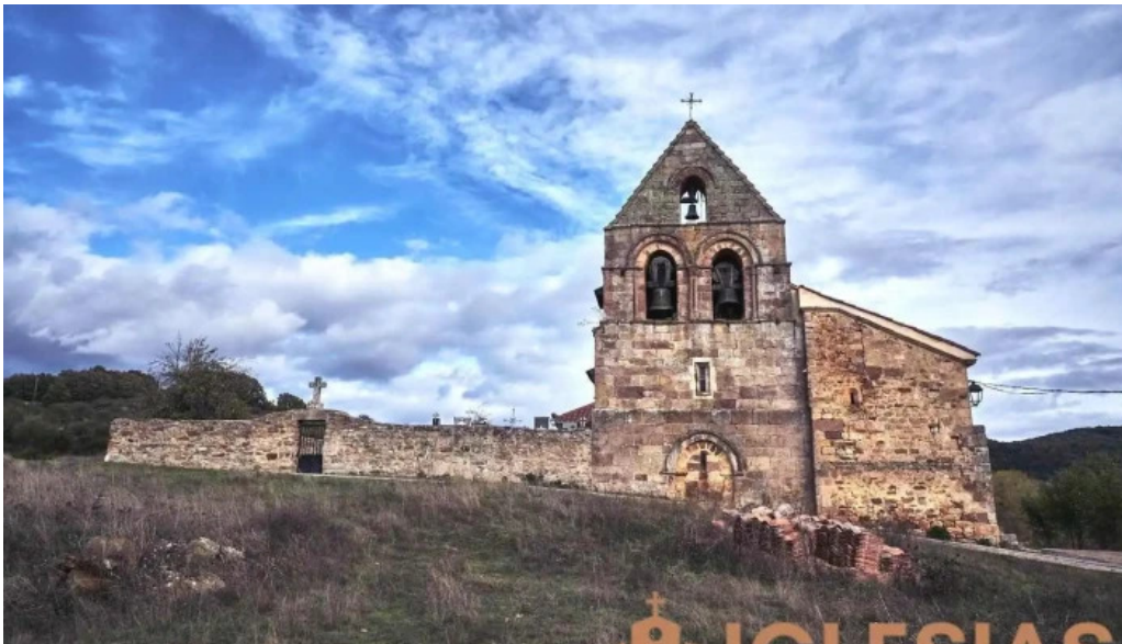
Iglesia de san pedro ad vinculam san felices de castillera