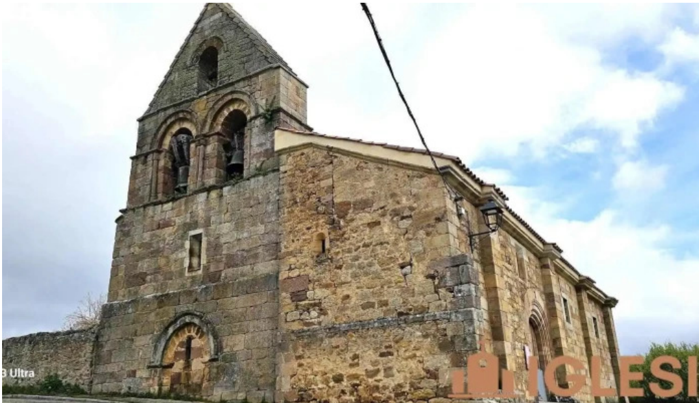
Iglesia de san pedro ad vinculam iglesia