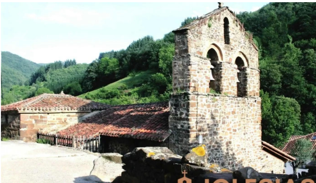
Iglesia de san andres iglesia