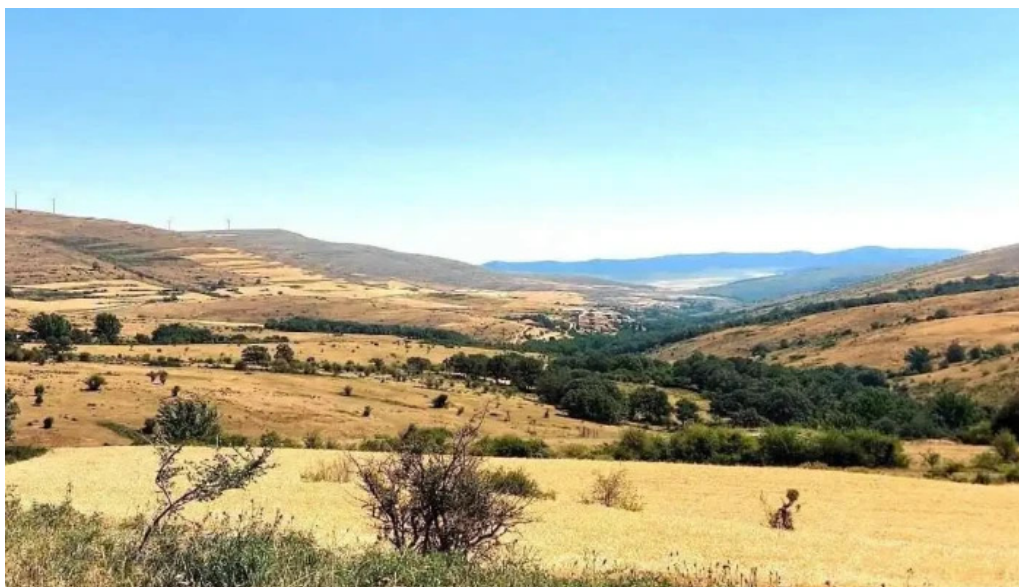
Iglesia de san andres apostol iglesia