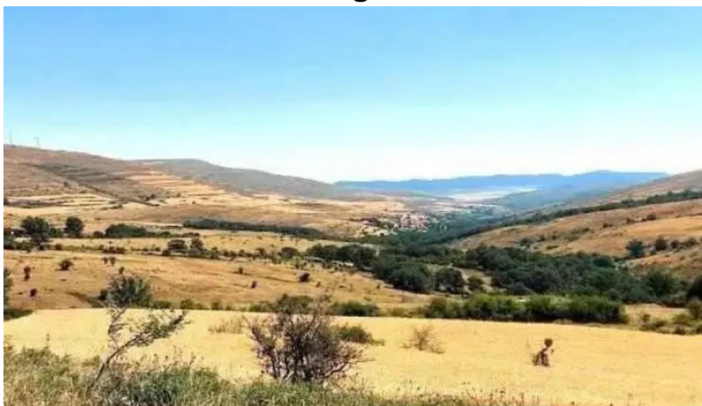
Iglesia de san andres apostol san andres de san pedro