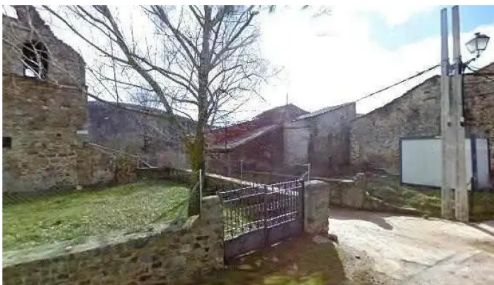
Iglesia de san andres apostol horario