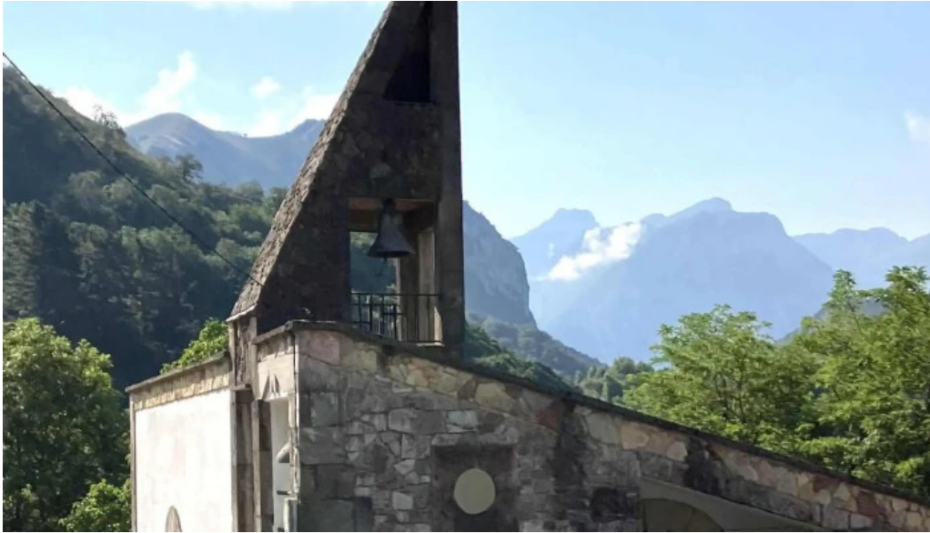
Iglesia de sames videos