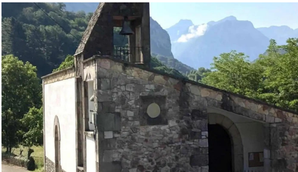
Iglesia de sames iglesia