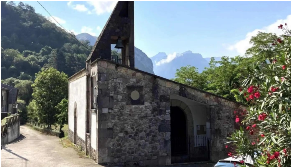
Iglesia de sames sames