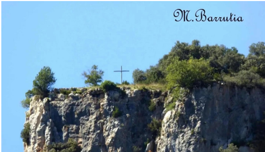
La santa cruz iglesia