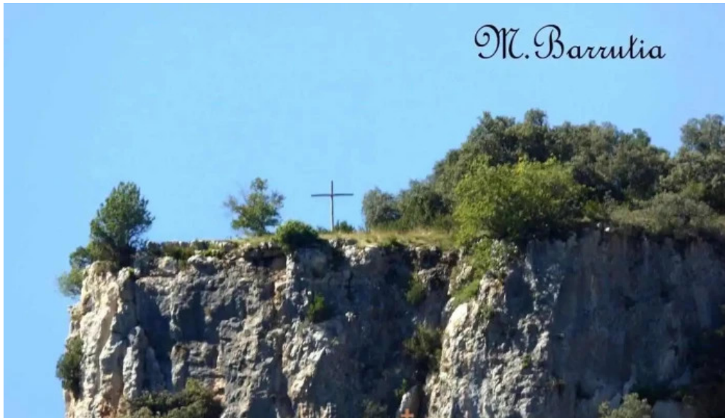
La santa cruz salvatierra de esca