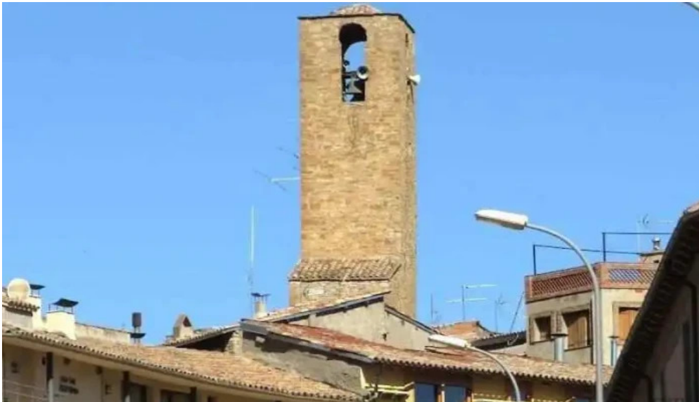
Iglesia de mare de deu del coll salas de pallars