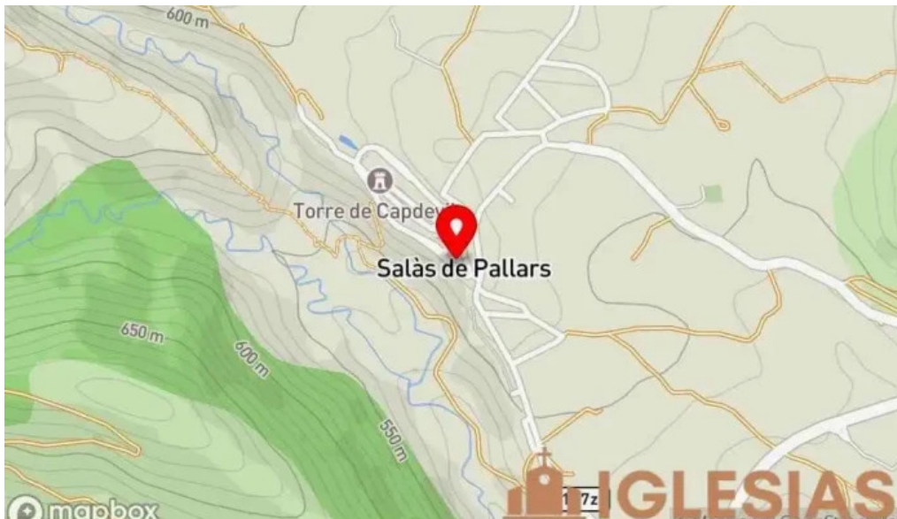
Iglesia de mare de deu del coll mapa