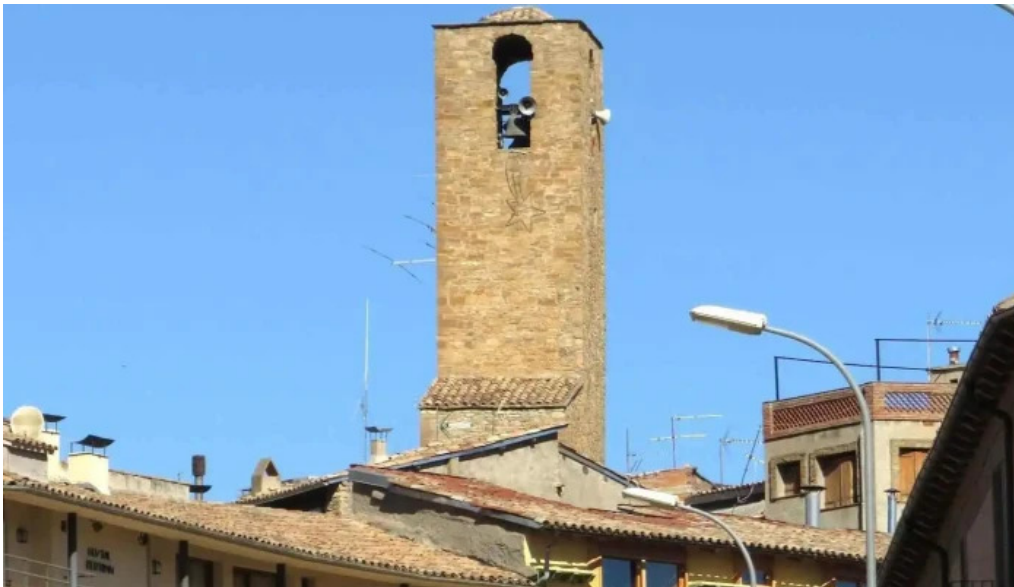
Iglesia de mare de deu del coll iglesia