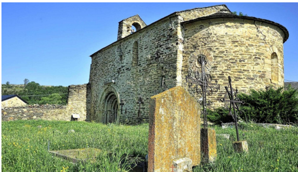
Iglesia de santa eugenia de saga iglesia