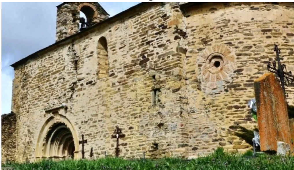
Iglesia de santa eugenia de saga saga