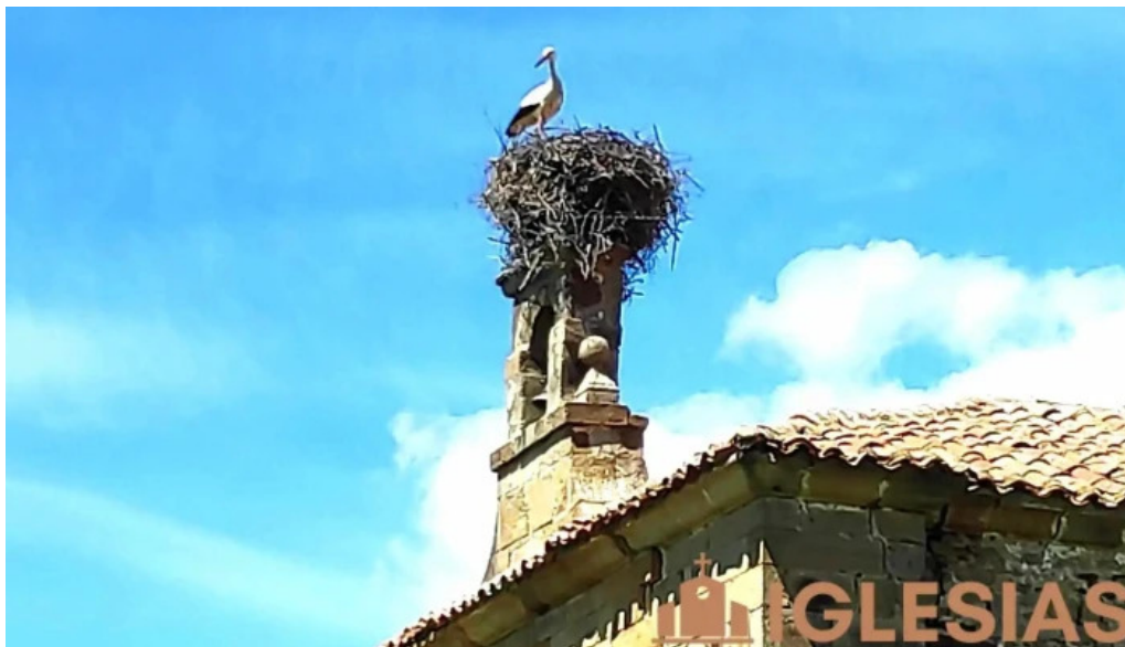
Ermita de nuestra senora de la soledad iglesia