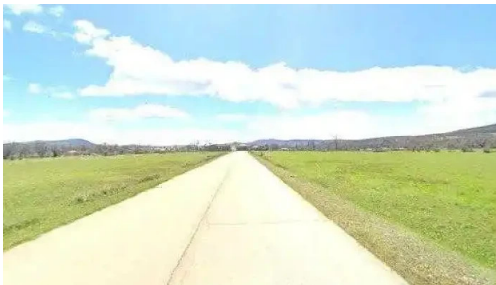
Ermita de nuestra senora de la soledad numero