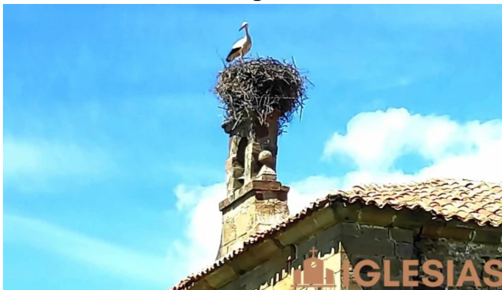
Ermita de nuestra senora de la soledad s andres de soria