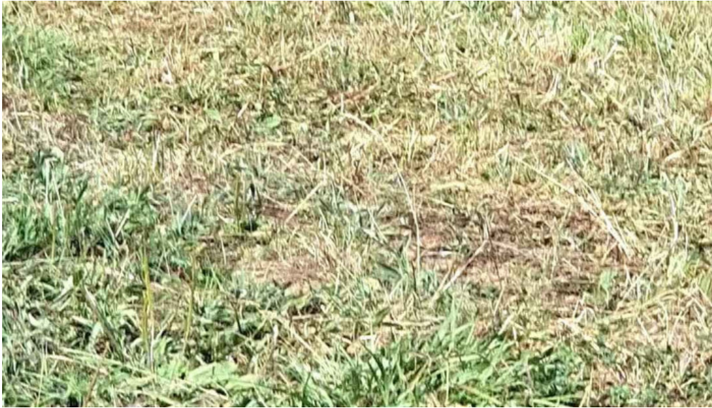
Iglesia de san adrian videos