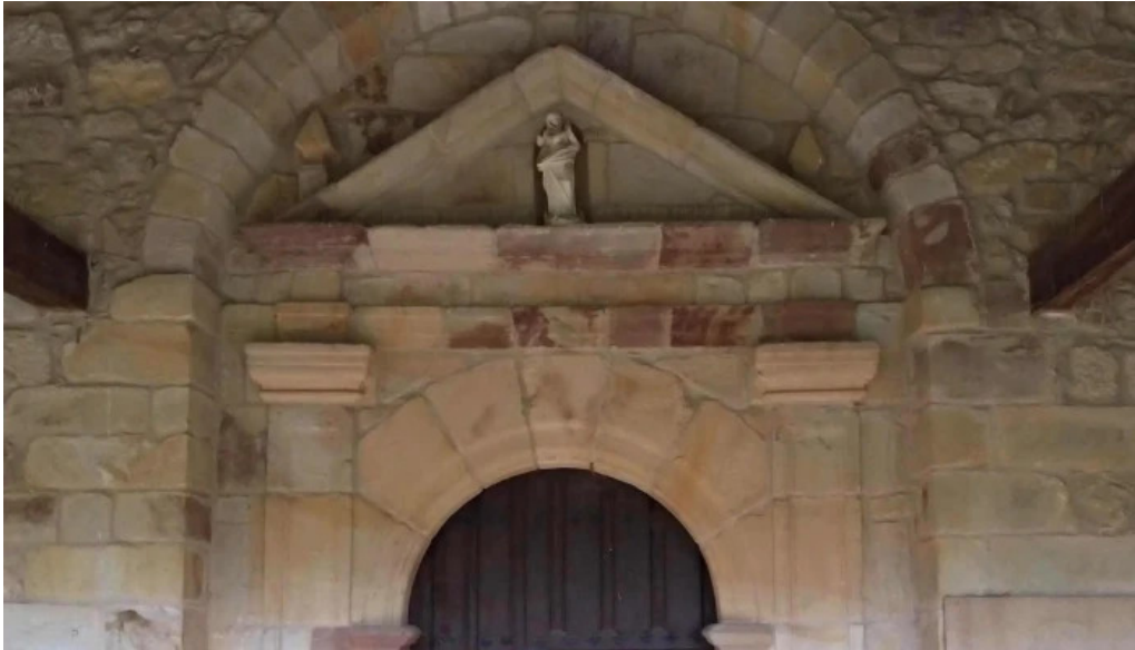
Iglesia de san adrian telefono