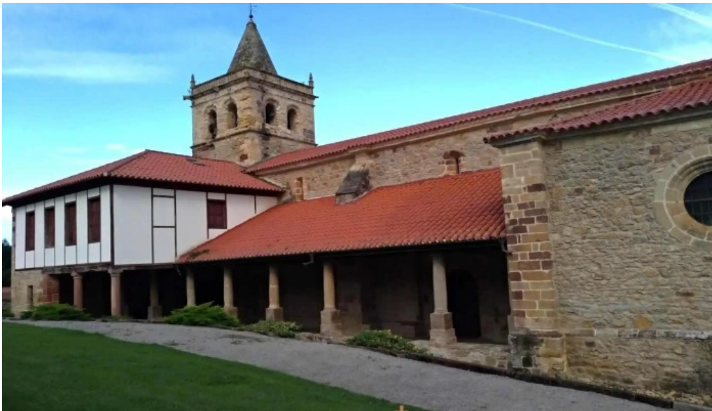
Iglesia de san adrian iglesia