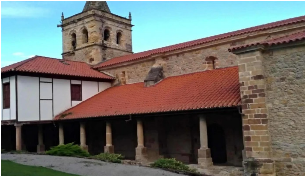
Iglesia de san adrian ruisenada