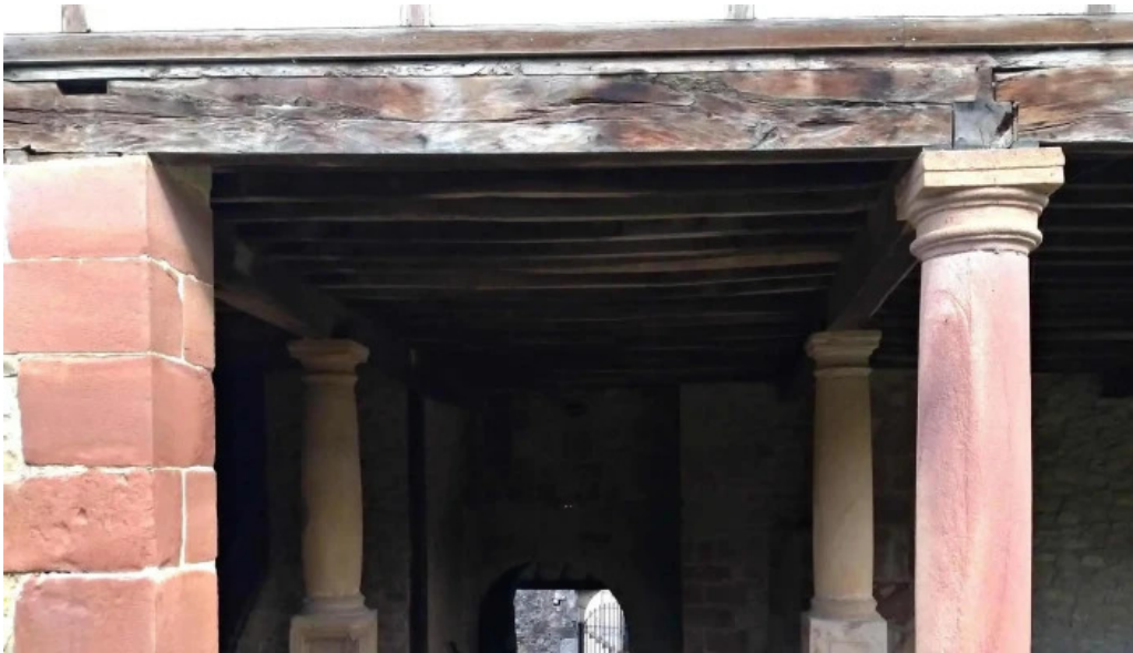
Iglesia de san adrian ubicacion