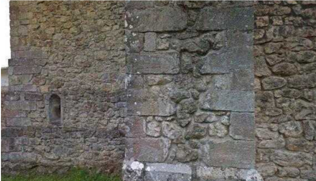
Parroquia de san sebastian iglesia