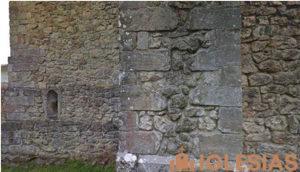
Parroquia de san sebastian ruente