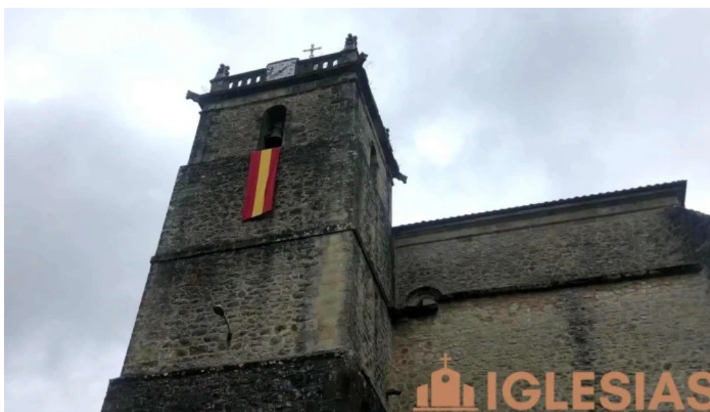
Parroquia del salvador de roiz iglesia