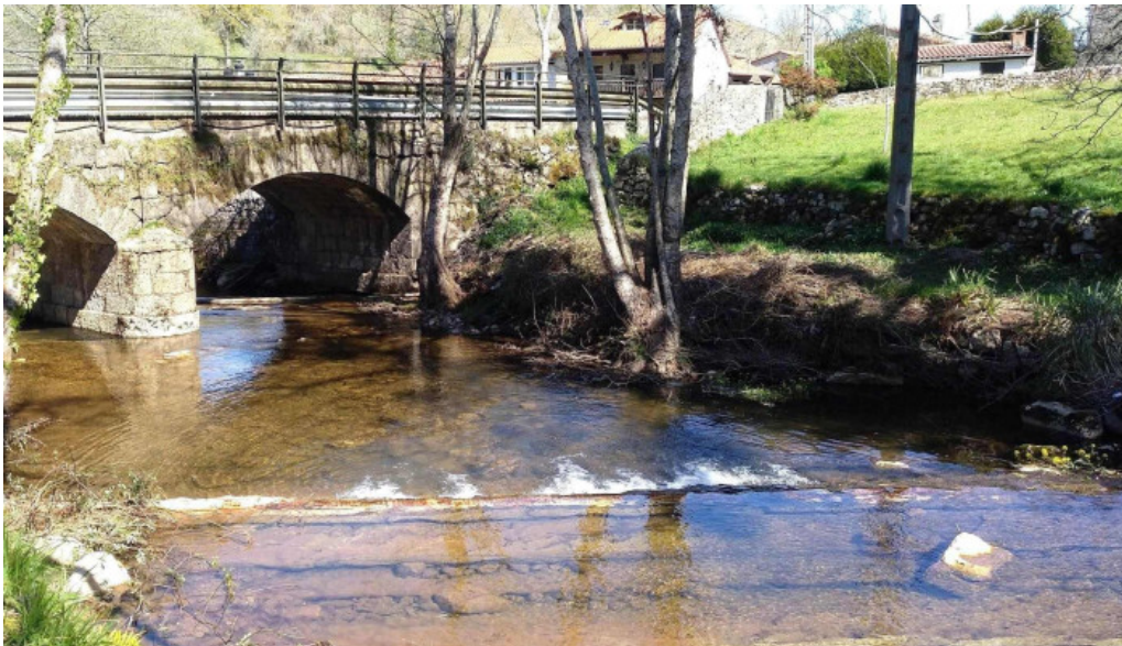
Parroquia del salvador de roiz promocion