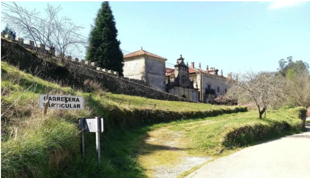
Parroquia del salvador de roiz roiz