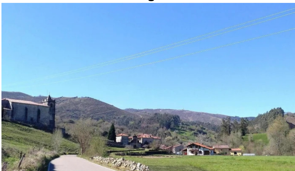
Parroquia del salvador de roiz zona