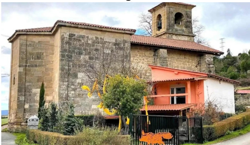
Iglesia de nuestra senora de la asuncion ribaguda