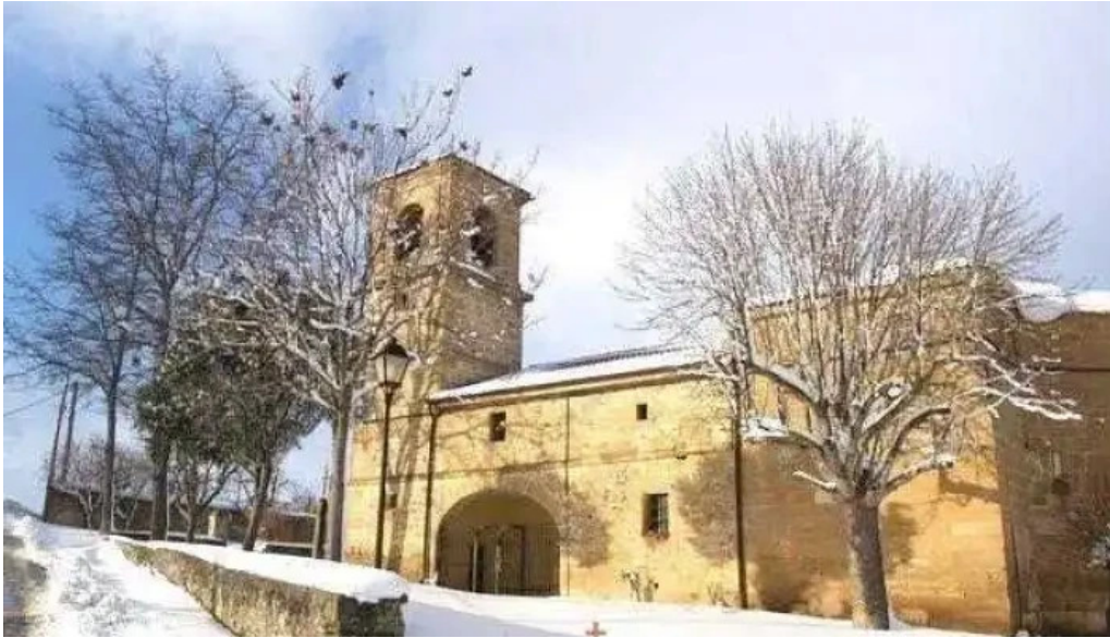
Iglesia de nuestra senora de la asuncion iglesia