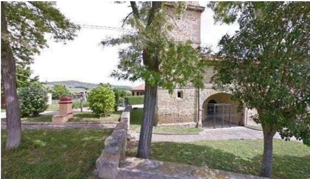
Iglesia de nuestra senora de la asuncion horario