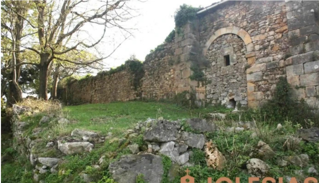
Ermita monasterio de san juan de la vera cruz iglesia