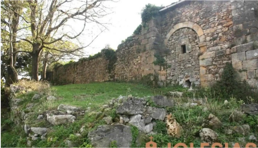
Ermita monasterio de san juan de la vera cruz rasines