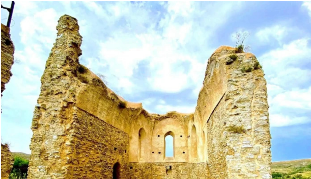
Iglesia de san andres fotos