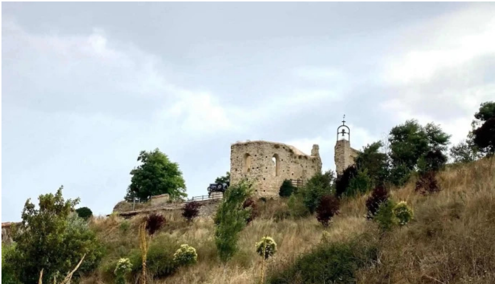
Iglesia de san andres quintanilla san garcia