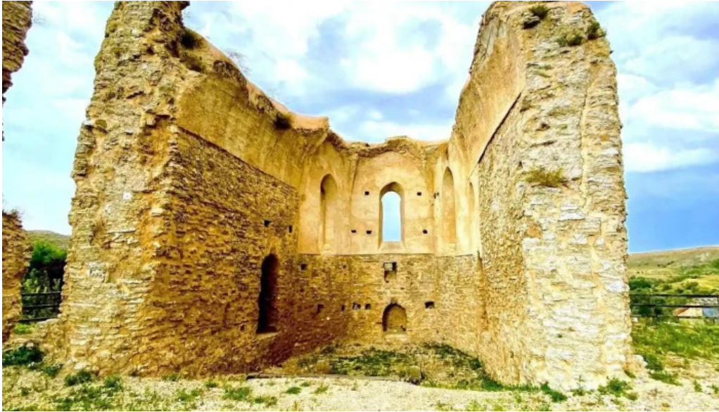
Iglesia de san andres iglesia