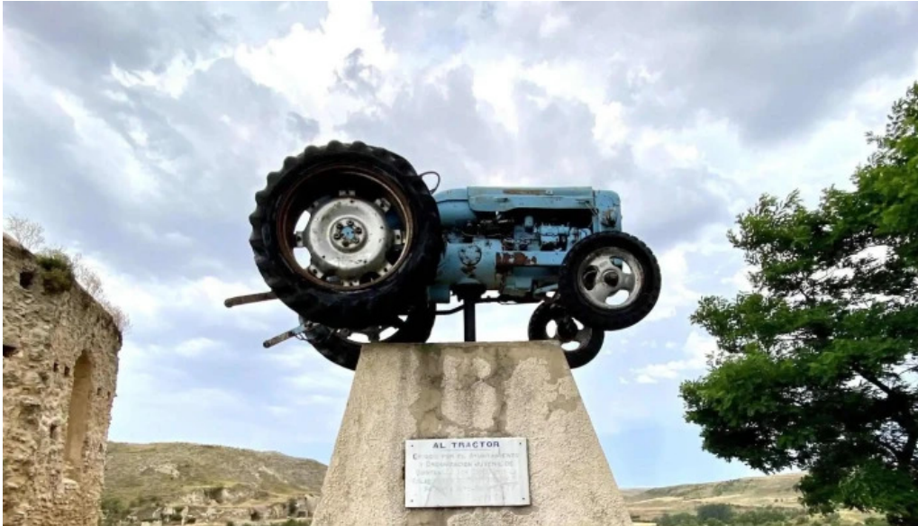
Iglesia de san andres opiniones