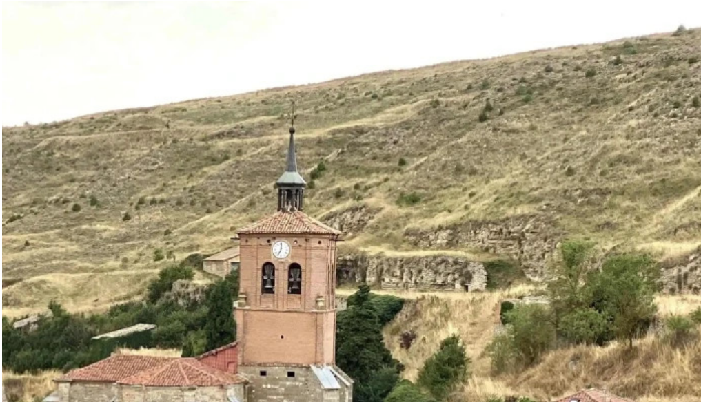
Iglesia de san andres abierto ahora