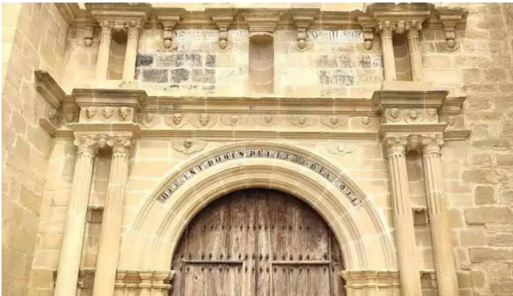
San esteban quintanilla de la ribera