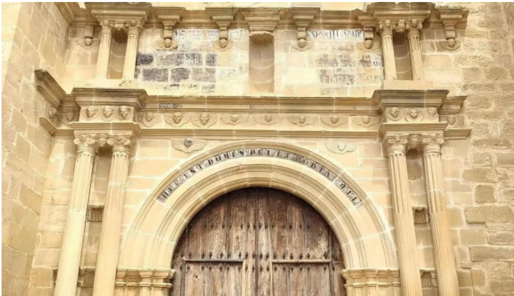
San esteban iglesia