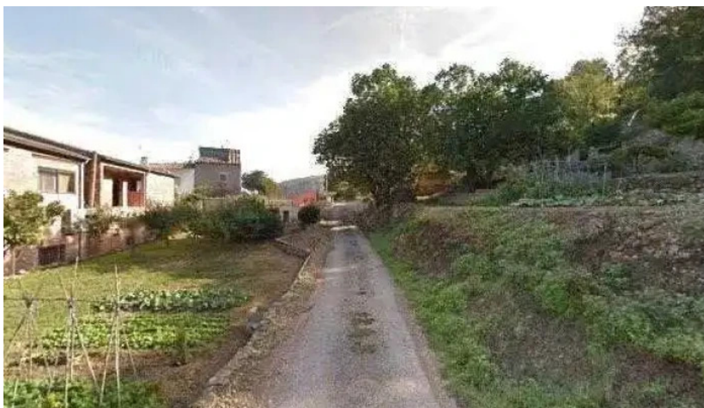
Sant jaume de valdecerves iglesia