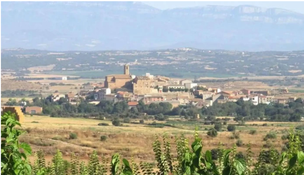
Esglesia de sant pere puigverd d agramunt