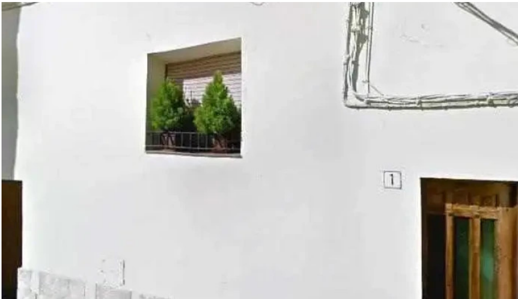
Esglesia de sant pere videos