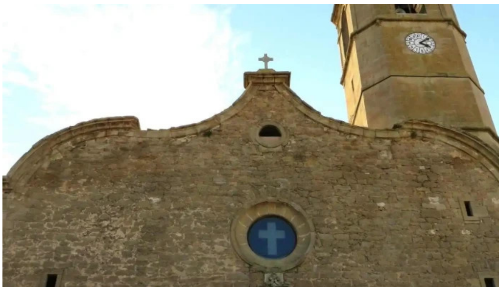
Església de sant pere iglesia