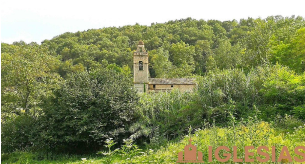
Iglesia de santa maria de puigpardines iglesia