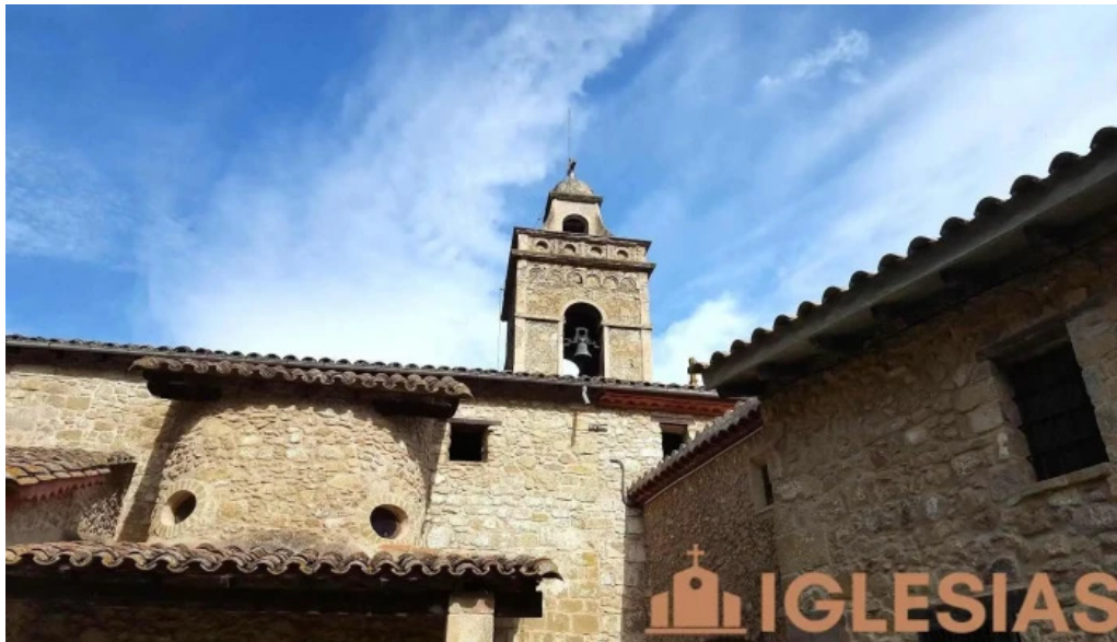
Iglesia de santa maria de puigpardines puigpardines