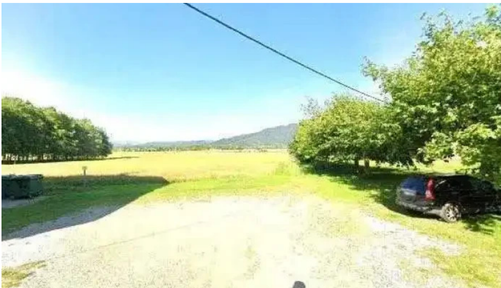
Iglesia de santa maria de puigpardines cerca de mi