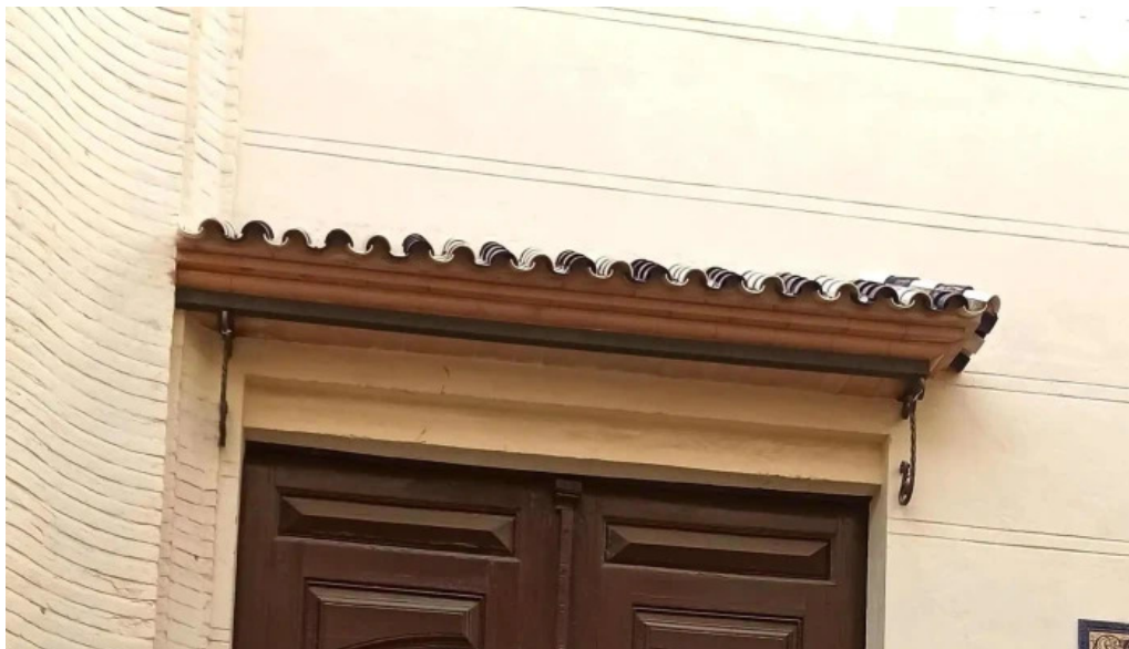
Iglesia ex convento de san francisco comentario 1