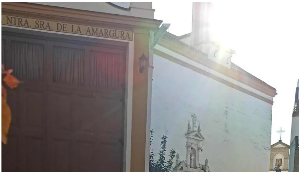
Iglesia ex convento de san francisco comentario 2