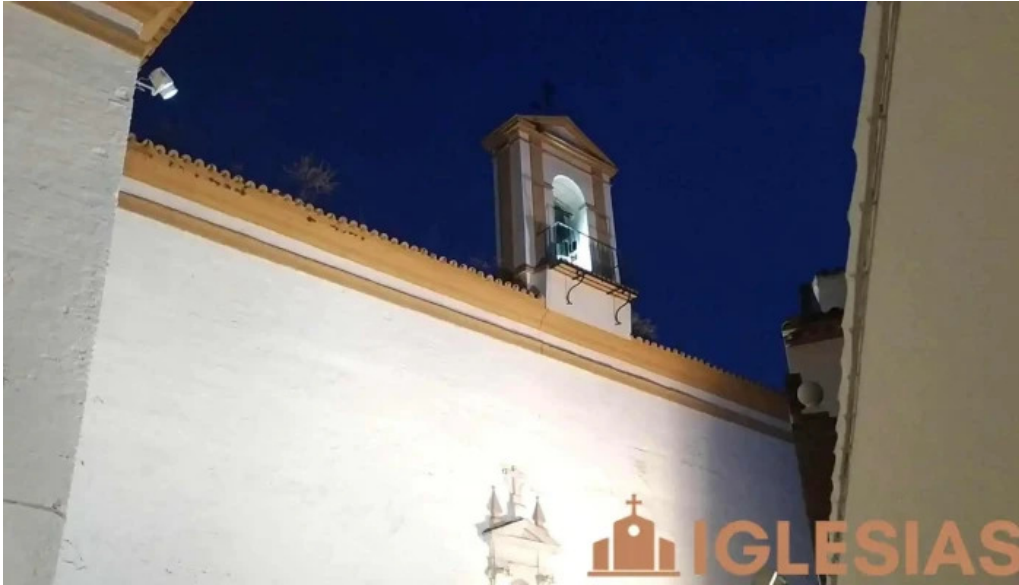
Iglesia ex convento de san francisco videos