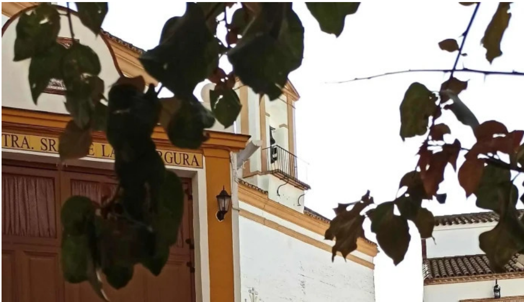
Iglesia ex convento de san francisco comentario 3