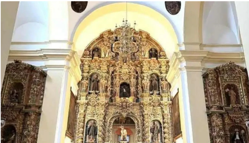
Iglesia ex convento de san francisco puente genil