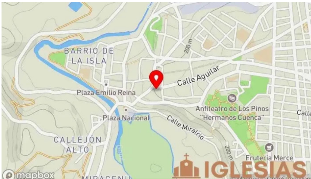
Iglesia ex convento de san francisco mapa