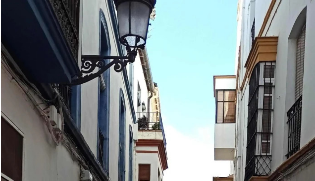
Iglesia ex convento de san francisco comentario 4