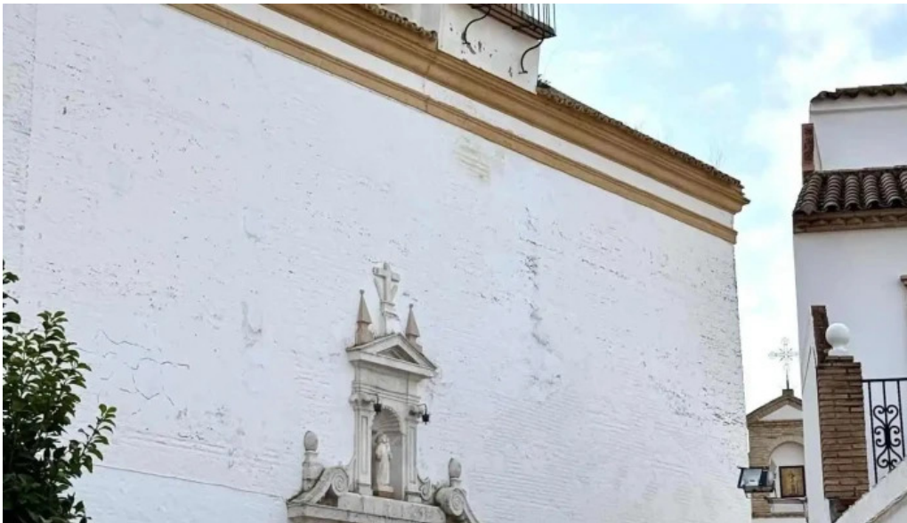
Iglesia ex convento de san francisco iglesia