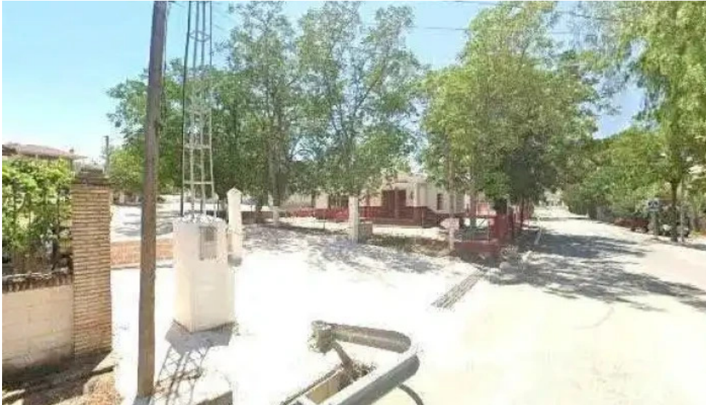
Ermita de san juan bautista iglesia