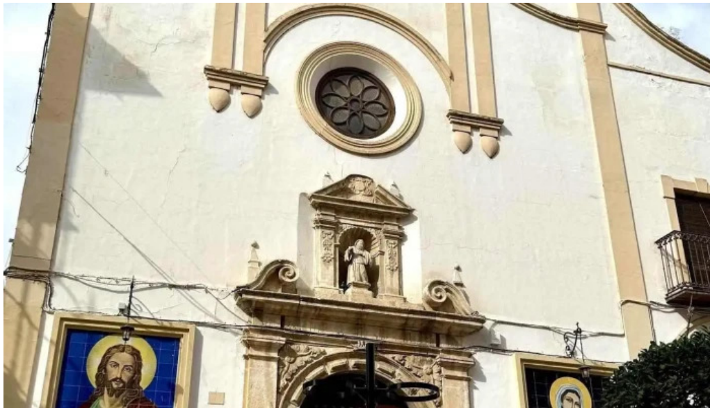
Convento de la victoria los frailes convento