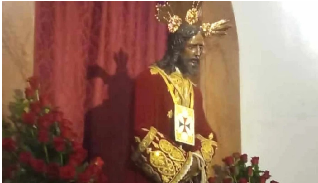
Convento de la victoria los frailes comentario 1