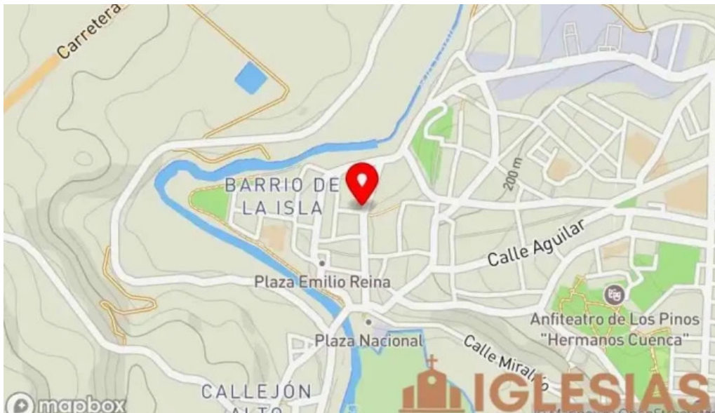
Convento de la victoria los frailes mapa