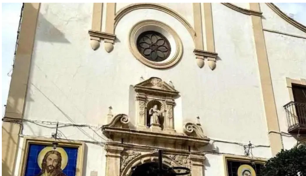
Convento de la victoria los frailes puente genil