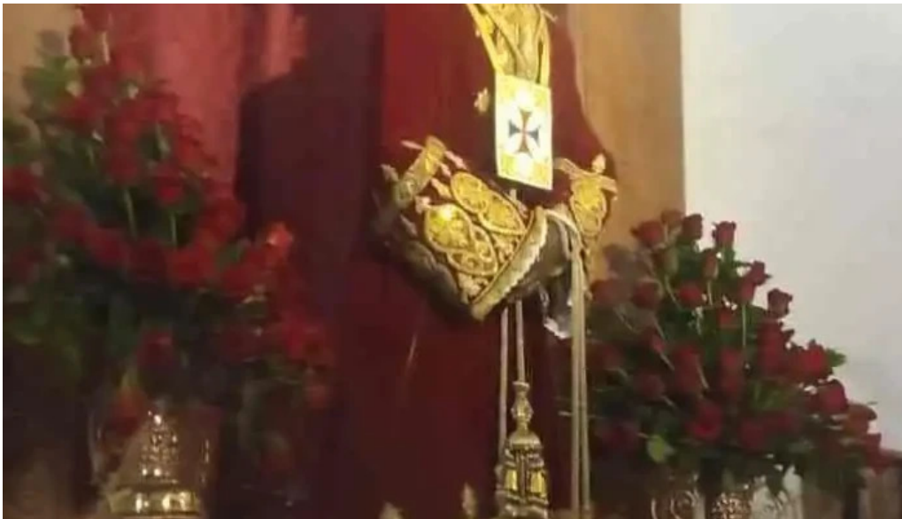
Convento de la victoria los frailes iglesia