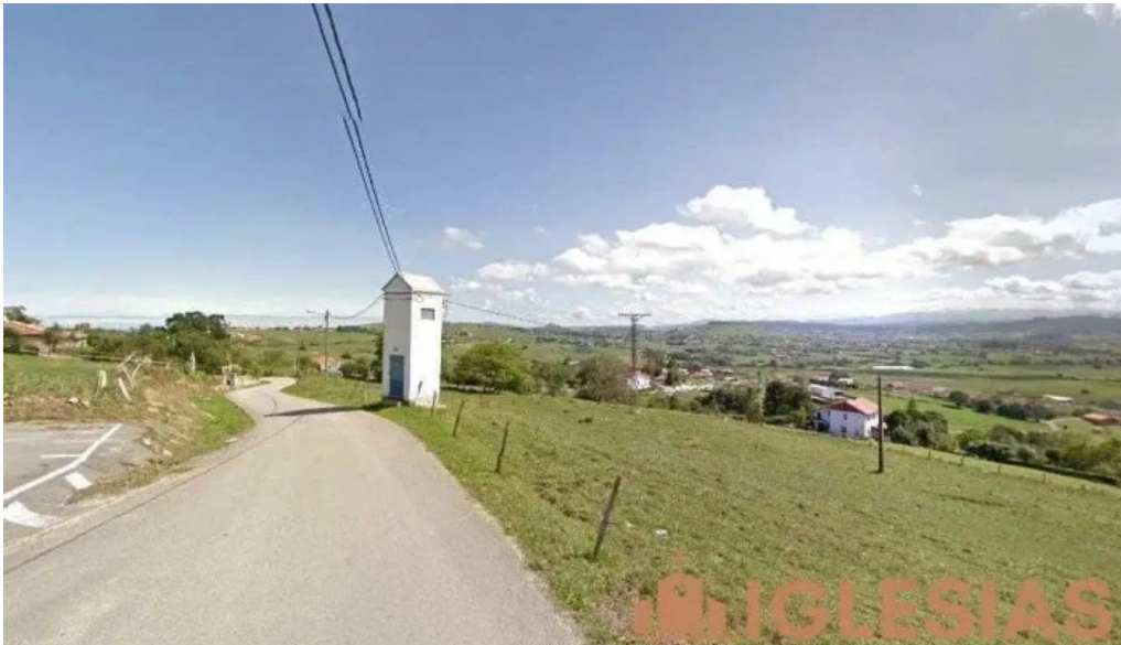
Iglesia de san andres puente avios