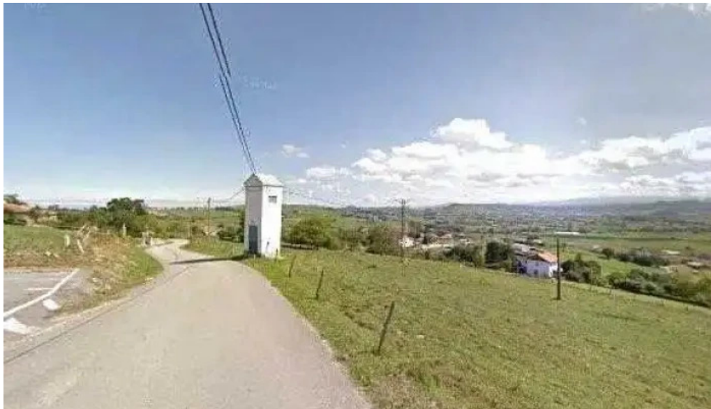
Iglesia de san andres iglesia