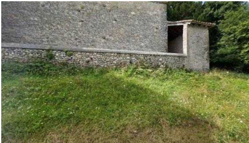
Iglesia de nuestra senora de los angeles videos