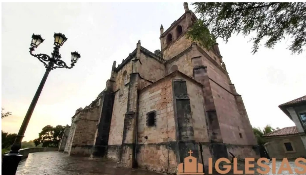
Iglesia de nuestra senora de los angeles iglesia