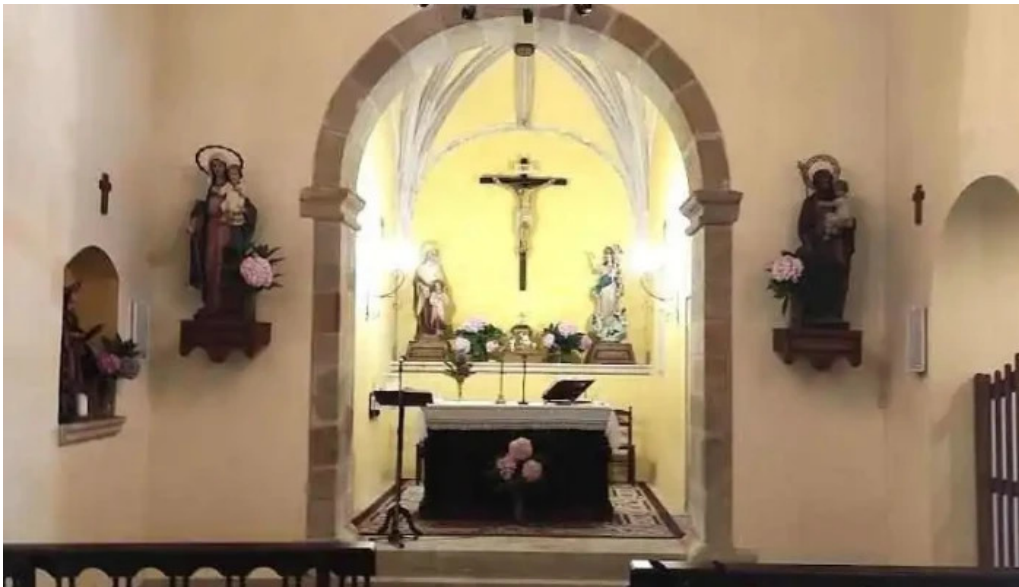
Iglesia de nuestra senora de los angeles prio