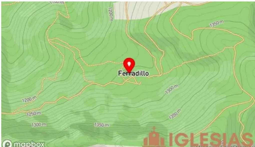
Iglesia de san bartolome mapa