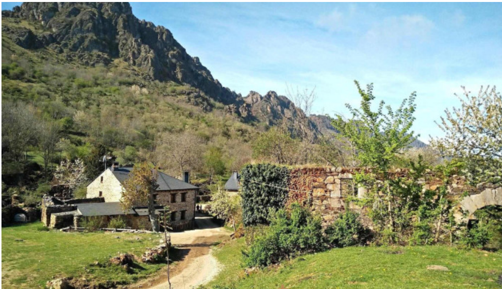
Iglesia de san bartolome iglesia