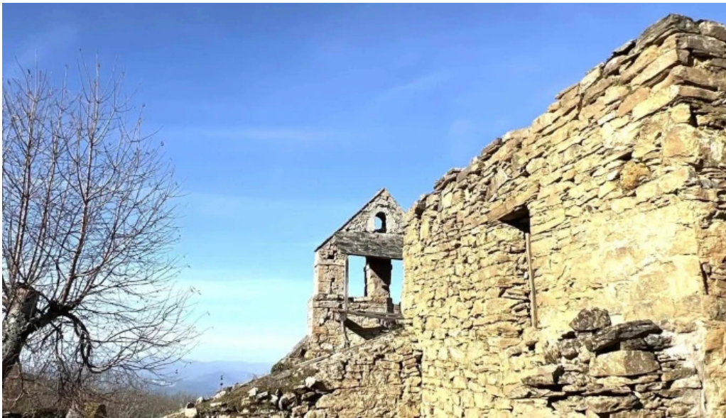
Iglesia de san bartolome priaranza del bierzo