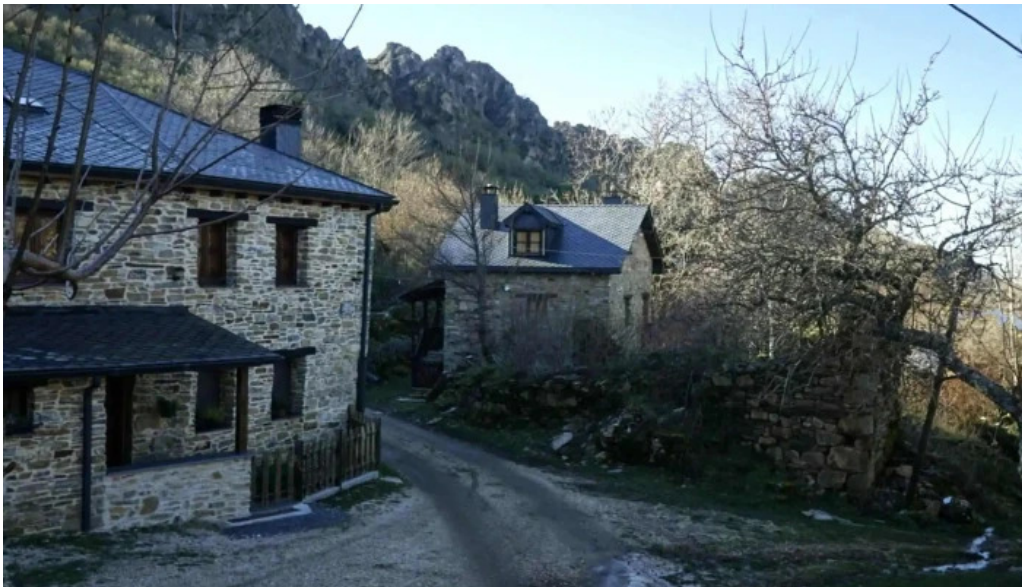
Iglesia de san bartolome catalogo