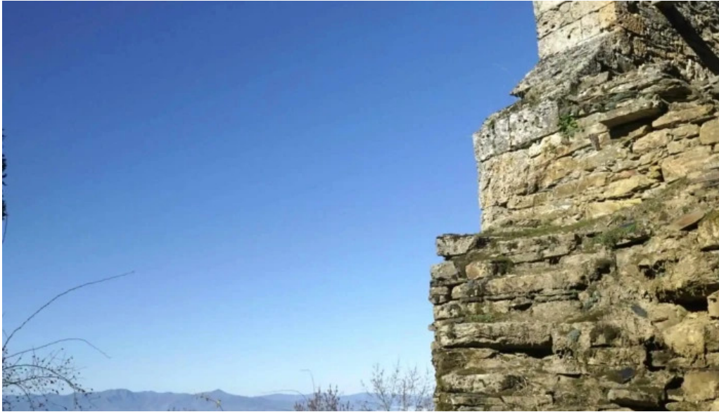
Iglesia de san bartolome horario