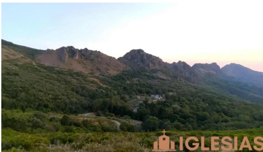
Iglesia de san bartolome videos