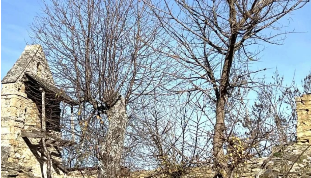
Iglesia de san bartolome telefono