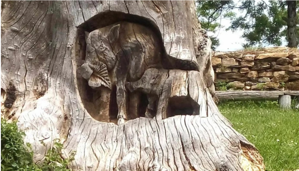
Iglesia de san bartolome abierto ahora