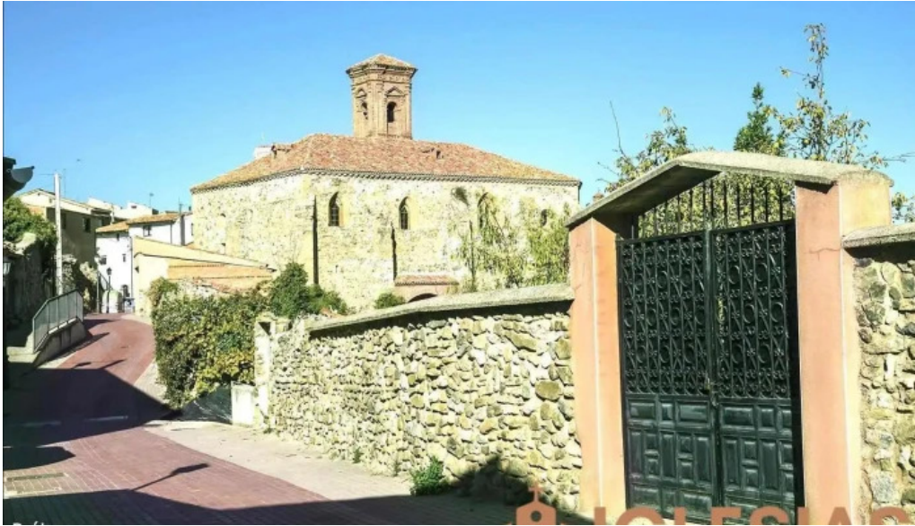
Iglesia de san miguel prejano