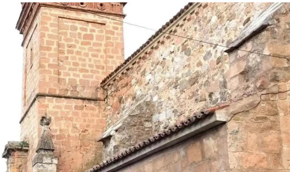
Iglesia de san miguel iglesia