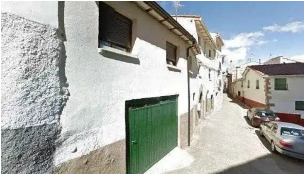
Iglesia de san miguel puntaje