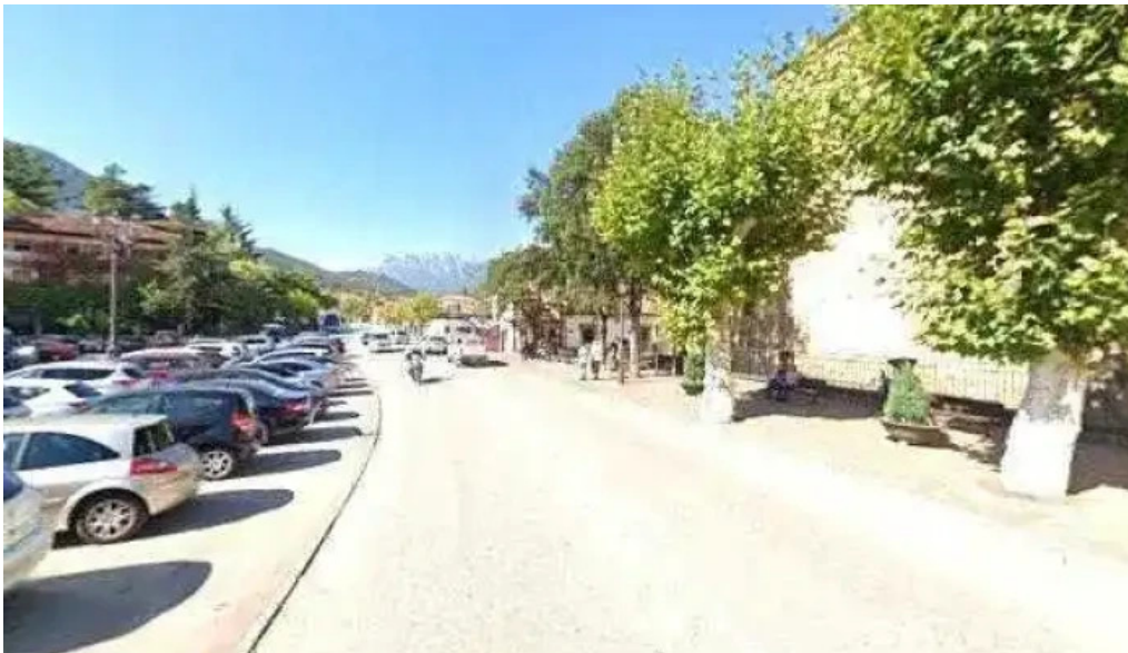
Casa parroquial iglesia