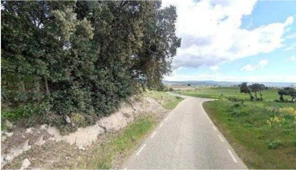
Iglesia de san andres iglesia