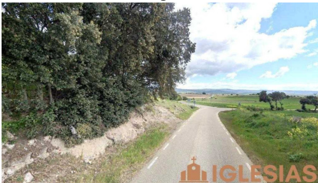
Iglesia de san andres portelarbol