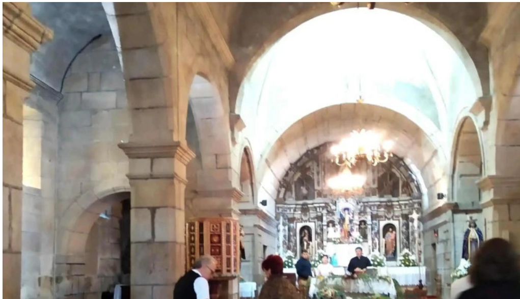
Iglesia de santa maria de troans zona