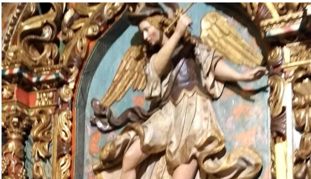
Iglesia de santa maria de troans horario