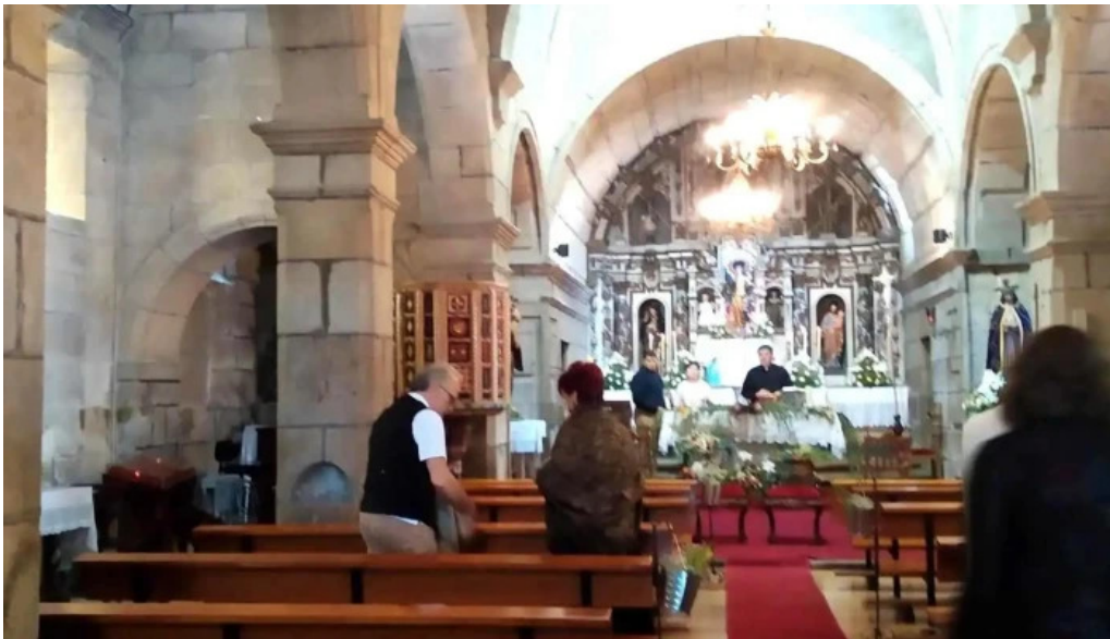
Iglesia de santa maria de troans iglesia