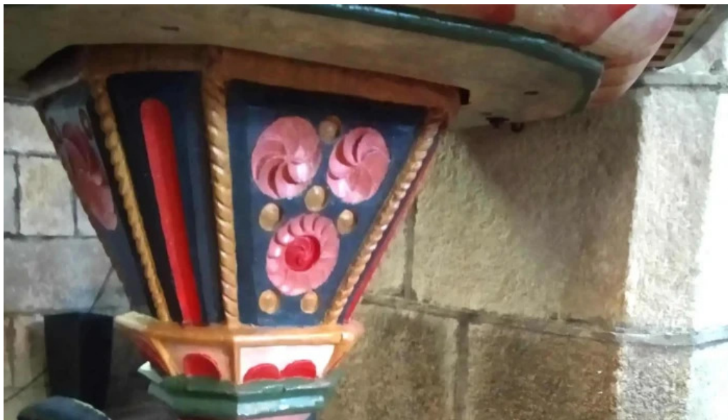
Iglesia de santa maria de troans pontevedra