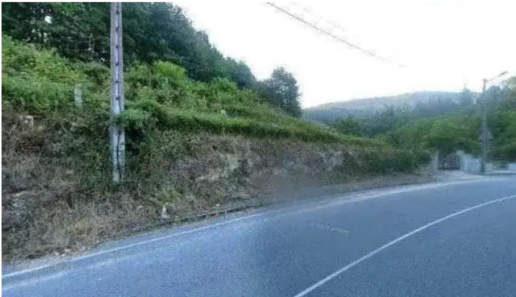
Iglesia de san juan de monterredondo pontebarxas