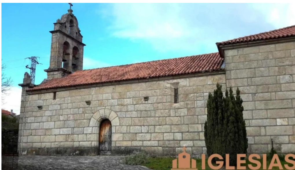
Iglesia de san juan de monterredondo iglesia